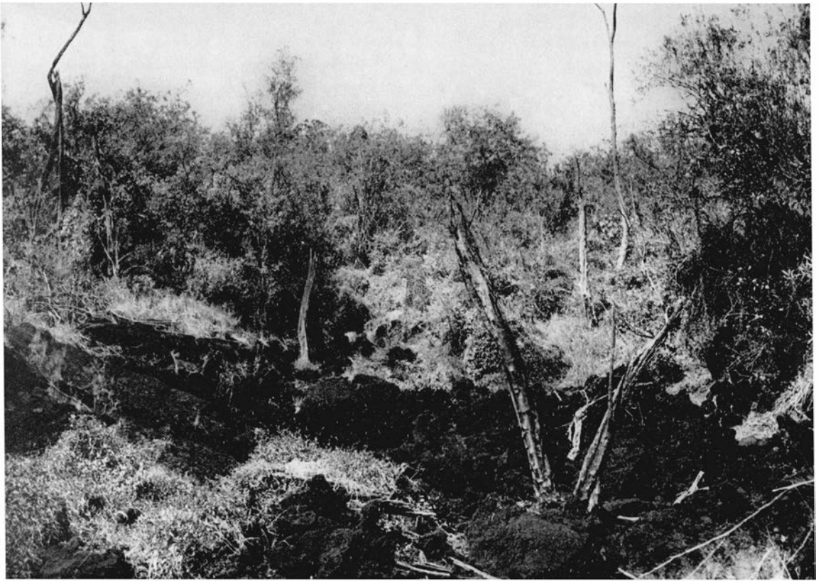
Ci-dessus , figure 3 : le masuku n° 7, Kamikoni, centre de la plaine de laves.