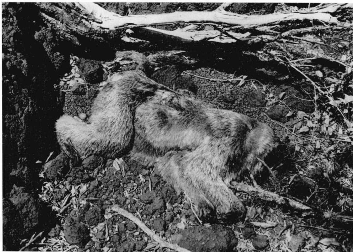
Ci-dessous , figure 8 : cadavre de Cynocéphale, dans le masuku n° 6.