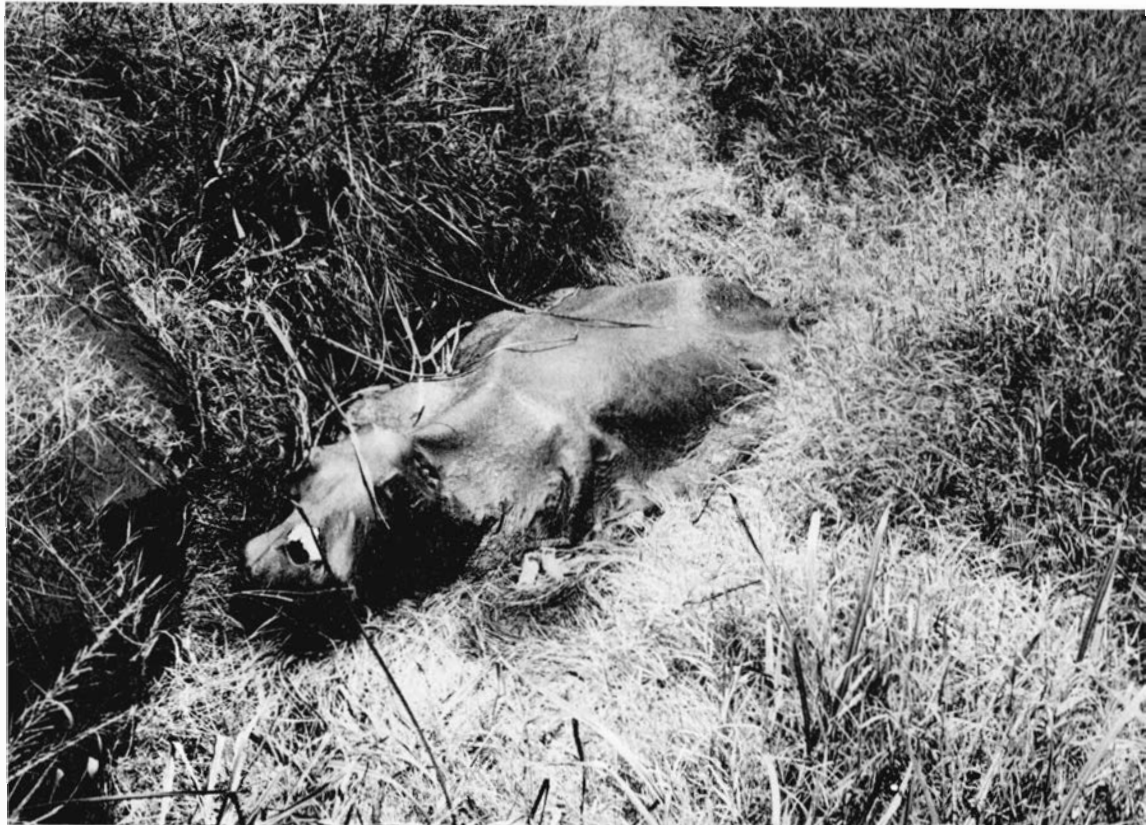
Ci-dessus , figure 7 : cadavre d'Hippopotame, dans le masuku n° 7.