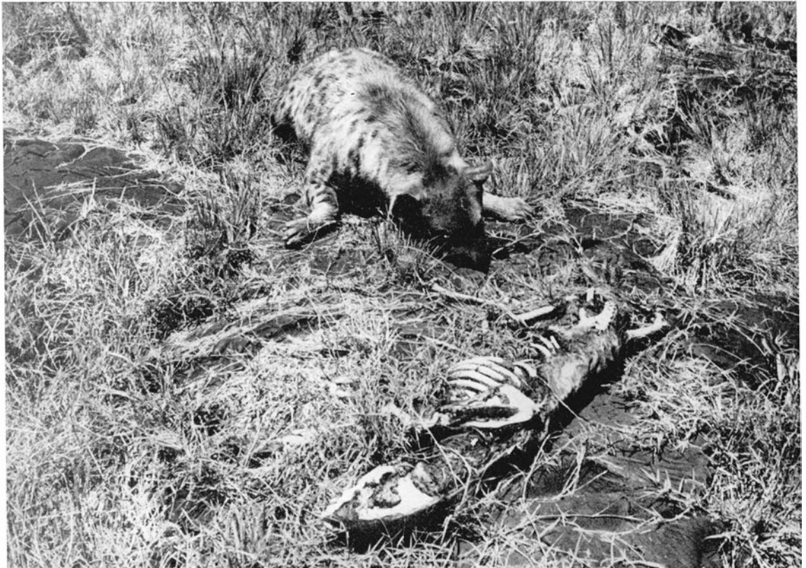
Ci-dessous , figure 4 : cadavres de deux Hyènes, dans le masuku n° 5.