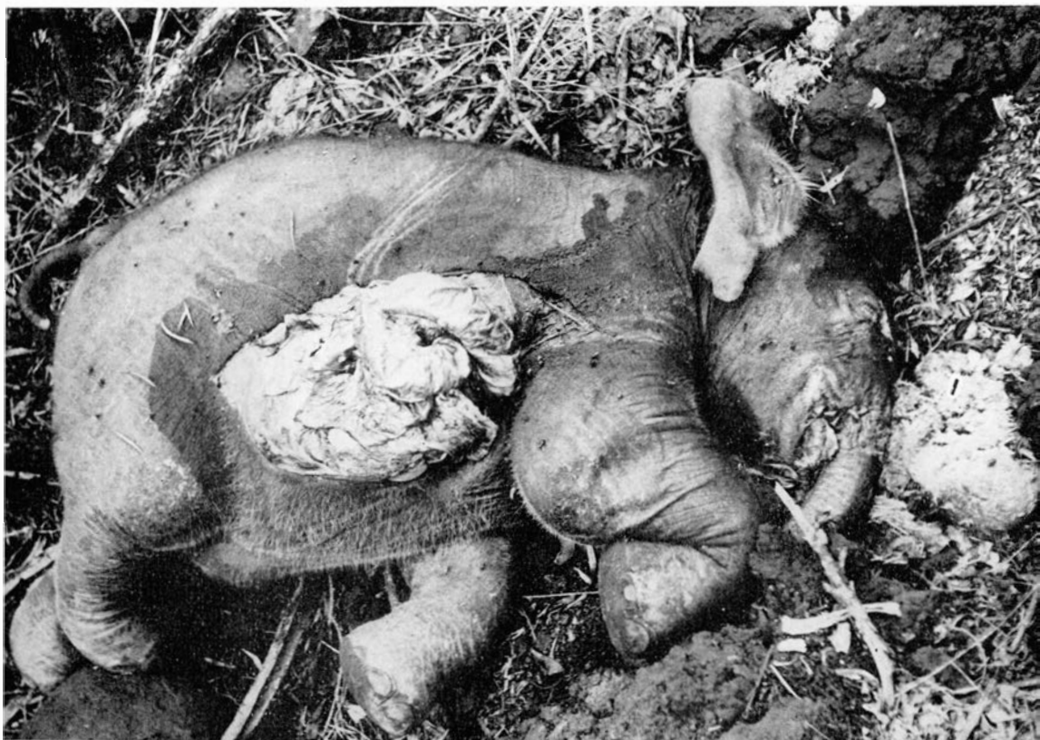
Ci-dessous , figure 6 : cadavre de jeune éléphant, dans le masuku n° 7.