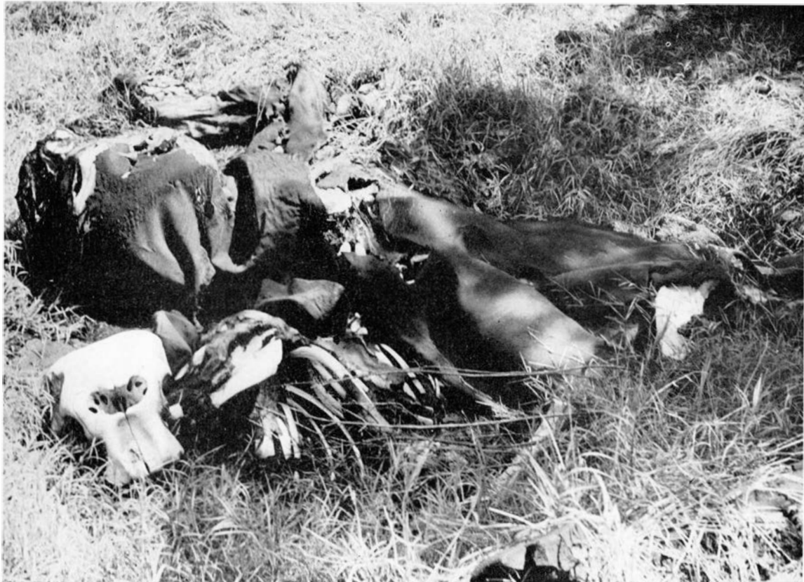
Ci-dessus , figure 5 : cadavre d'éléphant adulte, dans le masuku n° 5.