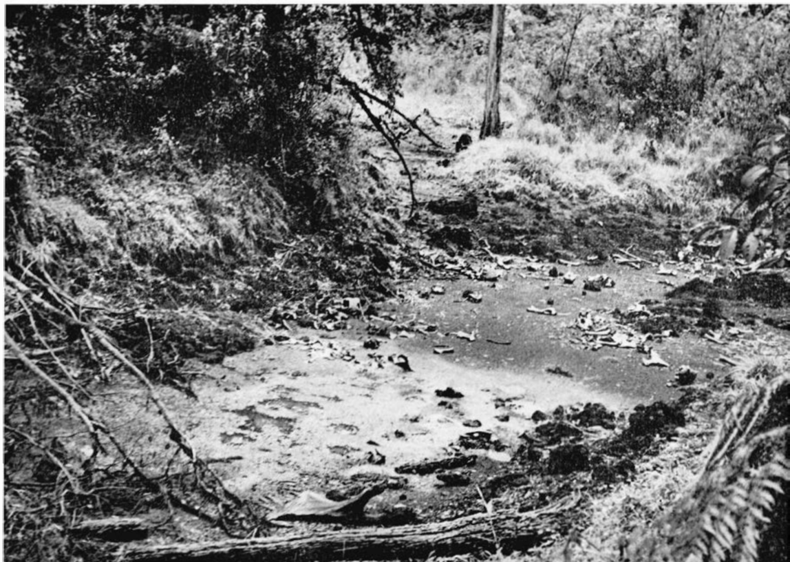
Ci-dessous , figure 2 : le masuku n° 2, mont Muvo.