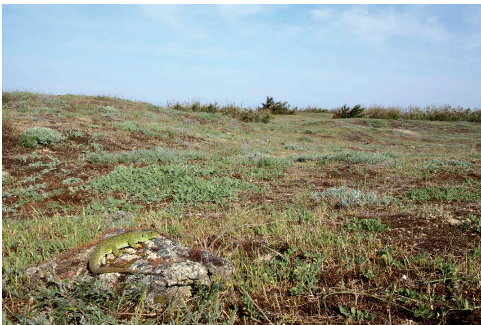
Figure 1. — Lézard ocellé dans un habitat de dune grise. Ocellated Lizard in fixed sand dune habitat.