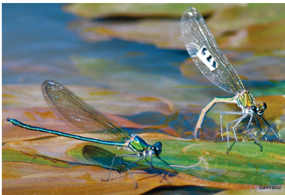
Figure 3. — Calopteryx exul , endémique maghrébin. En haut : mâle territorial. En bas : oviposition d'une femelle accompagnée par un mâle. Oued Seybouse, juin 2010.