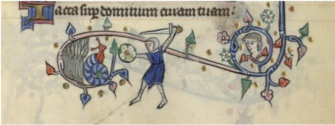
Fig. 7 Très riches heures de Metz , début XIV e siècle, METZ, Bibliothèque Municipale, ms. 1588, fol. 71r

Les marges suivantes proviennent de deux livres d'heures, également contemporains (début du XIV e siècle). La première est extraite des Très riches heures de Metz 32 .