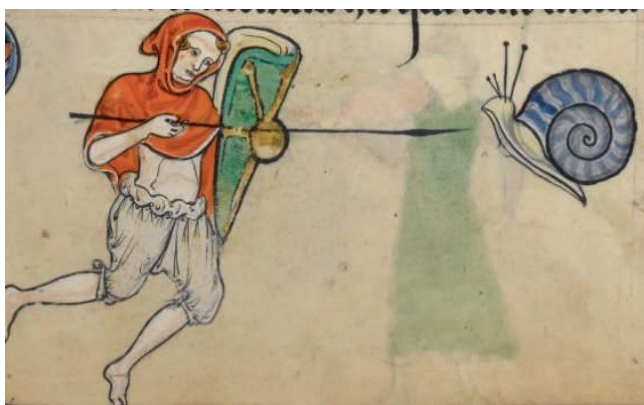
Fig. 3 Psautier de Rutland , ca 1260, LONDRES, BL, Add. Ms. 62925, fol. 48r

La représentation suivante n'est pas sans rappeler le dessin de Honnecourt : il est extrait du psautier de Rutland, conservé à la British Library (fig. 3, ca 1260) 25 . Il montre un individu dont l'identification ne renvoie pas à un chevalier : vêtu comme un paysan, à demi-nu et sans chaussures, il porte cependant des armes offensives et défensives face à un escargot débonnaire, quelque peu dressé face à lui. L'homme semble le défier d'avancer du bout de sa lance.