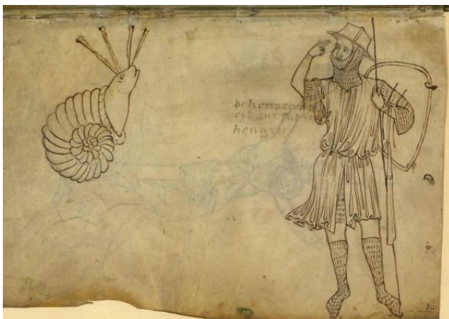
Fig. 2 VILLARD DE HONNECOURT, Carnets , ca 1230, PARIS, BnF, ms. fr. 19093, fol. 2r

La représentation suivante n'est pas sans rappeler le dessin de Honnecourt : il est extrait du psautier de Rutland, conservé à la British Library (fig. 3, ca 1260) 25 . Il montre un individu dont l'identification ne renvoie pas à un chevalier : vêtu comme un paysan, à demi-nu et sans chaussures, il porte cependant des armes offensives et défensives face à un escargot débonnaire, quelque peu dressé face à lui. L'homme semble le défier d'avancer du bout de sa lance.