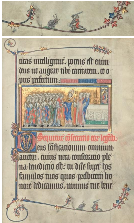
Fig. 9 et 9 bis. Pontifical de Renaud de Bar , XIV e siècle, PRAGUE, Bibliothèque Nationale de République Tchèque, ms. XXIIIC 120, fol. 35r

Les deux dernières drôleries appartiennent sans doute au même atelier de production, peut-être celui de Metz. Il s'agit de la deuxième partie du Pontifical de Renaud de Bar , conservé à la Bibliothèque Nationale de République Tchèque (fig. 9, 9 bis) 34 et du Bréviaire dit de Marguerite de Bar . 35 Le bréviaire a été commandé par Marguerite, abbesse de Saint-Maur à Verdun, pour son frère Renaud, futur évêque de Bar (1303-1316) 36 . Dans le pontifical, se distingue très clairement une scène grotesque où un chevalier chevauche un lapin pour frapper ou pour défendre à l'escarbot d'avancer.