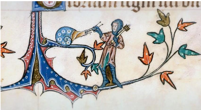
Fig. 4 Psautier dit de Gorleston , 1320-1325, LONDRES, BL, Add. Ms. 49622, fol. 185v

Les scènes suivantes sont extraites du psautier dit de Gorleston, conservé lui aussi à la British Library 26 . Ce livre manuscrit réalisé entre 1320 et 1325, peut-être à la demande du comte de Norfolk, constitue l'un des plus beaux exemplaires de manuscrits enluminés gothiques 27 . Il comprend neuf images mettant en scène des escargots 28 . Il ne s'agit toutefois pas des seules images représentant un homme armé face à un animal. En effet, on y trouve également deux scènes figurant un chevalier menaçant un singe, ainsi qu'un autre combattant un dragon. Cependant le détail des scènes illustrant les affrontements avec les escargots laisse apparaître un monde plus bigarré que celui des représentations habituelles. Les chevaliers ne sont pas seuls à affronter l'escargot. On découvre ainsi un homme nu tombé au sol et demandant grâce 29 , un paysan qui s'apprête à frapper le gastéropode 30 et un singe archer qui décoche des flèches à son adversaire invertébré 31 . Dans les six autres scènes, les chevaliers apparaissent toujours suivant la même disposition, à savoir qu'ils reposent sur les hampes des lettrines face au limaçon. Le vêtement est sensiblement le même. Ces combattants sont tous armés, c'est-à-dire qu'ils sont revêtus de pied en cap d'un haubert long, recouvert d'un tabard. Ils sont la plupart du temps dotés d'une épée à double tranchant, parfois d'un bouclier.