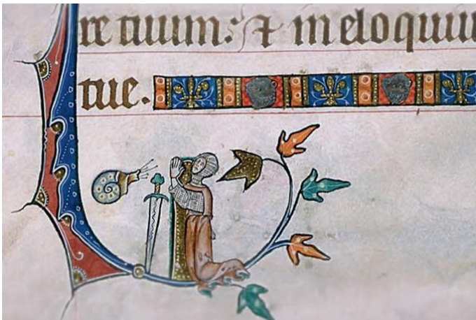
Fig. 6 Psautier dit de Gorleston , 1320-1325, LONDRES, BL, Add. Ms. 49622, fol. 162v

Armé d'une épée longue et protégé de son bouclier grotesque (qui tire la langue), il apparaît dans un équilibre précaire face au paisible limaçon. La dernière image (fig. 6), extraite du même manuscrit, met en scène un autre duel, qui pousse la dérision à son comble. Un chevalier semble déposer les armes devant un escargot et lui demande grâce les mains jointes :