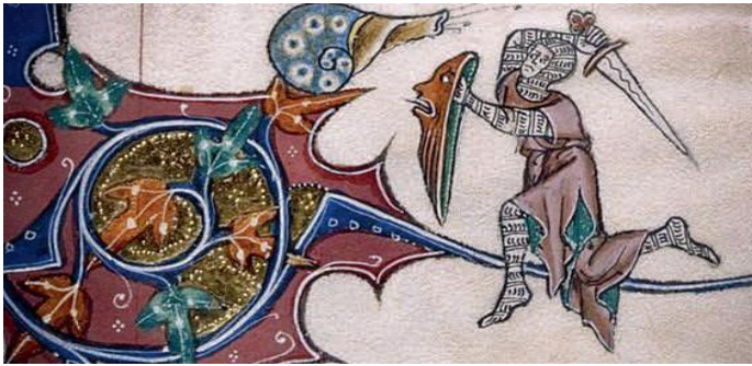
Fig. 5 Psautier dit de Gorleston , 1320-1325, LONDRES, BL, Add. Ms. 49622, fol. 193v

d'autres scènes où flèches et cornes se confondent. Cette métaphore des cornes et des flèches est un motif que l'on retrouve dans d'autres scènes du même genre. La seconde illustration (fig. 5) dessine un affrontement entre un chevalier et un escargot dont les cornes dardent comme des flèches menaçantes qui font fléchir son adversaire.