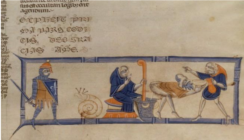
Fig. 1. Code de Justinien , XIII e siècle, PARIS, BnF, ms. lat. 4535, fol. 176r

ce choix était-il aussi libre ou était-il guidé ? J'y reviendrai dans mon dernier point, après l'examen de la mise en décor elle-même. La première image est extraite d'un exemplaire du Code de Justinien réalisé à Bologne au milieu du XIII e siècle (fig. 1) 23 . L'image est divisée entre deux scènes grotesques regroupées dans un même cadre, figurées presque dos à dos. La première montre un chevalier portant armure, bouclier et casque à nasal. Il est armé d'une épée, et plutôt dans l'expectative face à un escargot géant. La seconde partie de l'image est une mise en scène scatologique, sans lien avec la première.