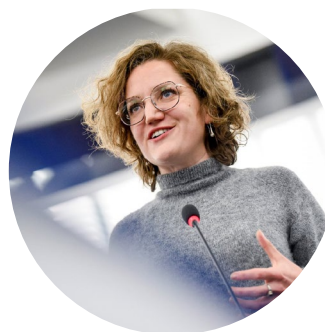
Marie Toussaint Membre du Parlement européen pour la France Groupe Greens/EFA

L'Europe peut, et doit, s'engager dans cette voie. La crise environnementale ne nous laisse plus le choix. Déjà quatre des neuf limites planétaires ont été dépassées. Plus que jamais, nous devons sauver ce qui peut l'être. C'est une question de survie, et de justice. L'Europe doit donc sans attendre participer à cette révolution juridique et inventer un droit à la hauteur de l'urgence écologique et climatique, un droit qui assure la justice environnementale et sociale, et qui permette de protéger efficacement la nature dont nous, et les générations futures, dépendons. Cette étude, qui devra être poursuivie par d'autres et trace des pistes qui doivent indispensablement être discutées avec l'ensemble de la société européenne, n'est pas exhaustive. Il nous faudra aussi réformer nos Traités, nos lois fondamentales. Elle pose toutefois une pierre sur la route pavée d'un changement de modèle.