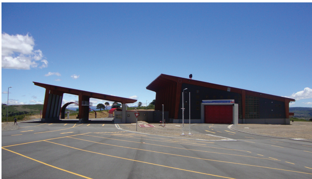
FIG. 5: Complejo fronterizo Pino Hachado

Por otro lado, a muy pocos kilómetros de este lugar, se proyectó la construcción del nuevo complejo fronterizo Pino Hachado, más cerca de la frontera que el anterior, ubicado en Liucura, varios kilómetros más abajo. La segunda fotografía, tomada a comienzo del 2013, muestra este nuevo y moderno complejo, días antes de su inauguración. Lo sorprendente es que este complejo solo sirve para el control de los flujos de ingreso a Chile. El control de los flujos de salida hacia la Argentina se sigue efectuando en el antiguo complejo de Liucura. Dicho de otro modo, existe una franja de varios kilómetros en la cual solo se puede transitar tras haberse sometido a algún control de la aduana chilena. Lo cierto, y lo interesante, es que esta franja coincide precisamente con la extensión de la Reserva Nacional Alto Bío-Bío. Más interesante aún, es que es también en esta franja donde las comunidades mapuche-pehuenches proyectan la reconstrucción de su territorio (fig. 5).