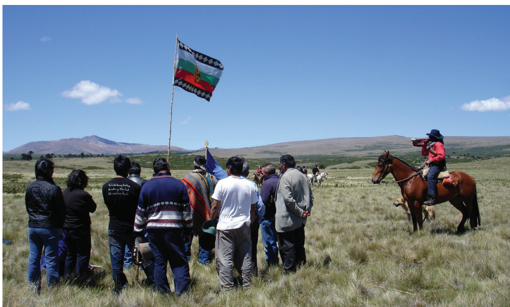
FIG. 4: Comunidades plantan bandera en Cerro Bayo

La primera fotografía fue tomada a comienzo del 2008 en un sector de la Reserva conocido como Cerro Bayo. Estos últimos años, Cerro Bayo ha sido el objeto de disputas entre las comunidades mapuche-pehuenches aledañas y los colonos establecidos en el sector que lo han solicitado formalmente a la Corporación Nacional Forestal para veranear . En este contexto, un grupo de mapuche-pehuenches de las distintas comunidades del sector plantaron en Cerro Bayo una bandera mapuche, aquella que se utiliza también al otro lado de la frontera como símbolo del proceso de reunificación del pueblo mapuche. La fotografía muestra la ceremonia que se realizó en esta ocasión, con la bandera flameando en trasfondo (fig. 4).