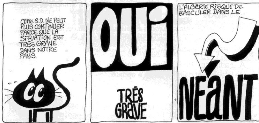
Figure 1. Gatt, un chat porte-parole de la satire politique (détail de la 4 e de couverture de Slim, 1986).

intitulée Slim, Zid Ya Bouzid I et II 3 .