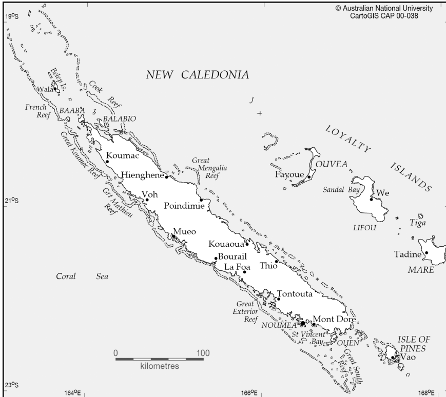
FIGURE 2 : Nouvelle Calédonie.