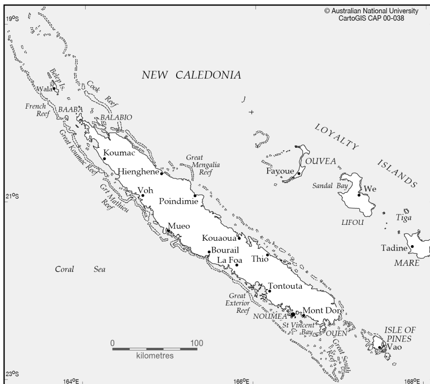
FIGURE 2 : Nouvelle Calédonie.

Mais lorsque l'ordre est donné, le 23 avril 1853, au contre-amiral Febvrier des Pointes 20 et à l'officier Tardy de Montravel 21 , de prendre solennellement possession de la Nouvelle-Calédonie en deux points, il n'est prévu de négocier ni traité, ni cession de territoire, pas plus qu'il n'est prévu d'obtenir la signature attestant le consentement des chefs sur le document actant la prise de possession, exception faite du chef Vendegou de l'île des Pins. Tardy de Montravel tient à confirmer les actes de prise de possession par des reconnaissances de souveraineté obtenues auprès des principaux chefs de la côte est. En échange de la protection que leur confère leur nouvelle nationalité, ces derniers doi-