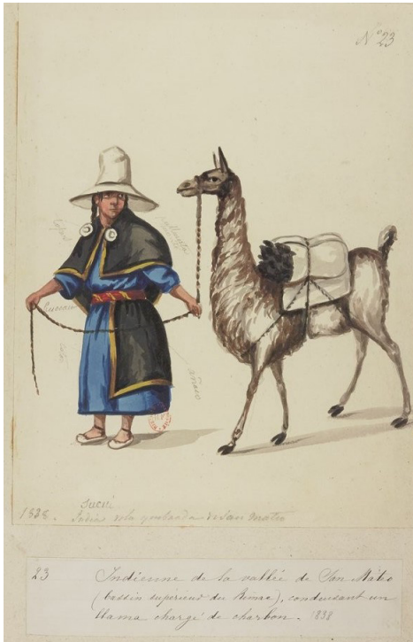
Imagen 2. “India del valle de San Mateo (Cuenca superior del Rímac) conduciendo una llama cargada de carbón 1838” (Traducido del francés). L. Angrand. Álbum 1, f. 27. https://gallica.bnf.fr/ark:/12148/btv1b10540832f/f27.item .