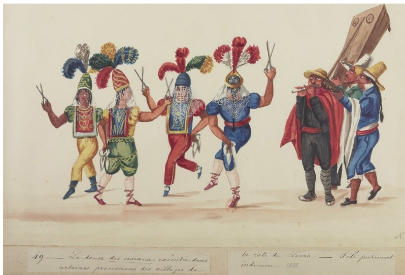
Imagen 4. “Baile de tijeras ejecutado en algunas procesiones de los pueblos de la Costa de Lima. Fiesta exclusivamente india”. L. Angrand. Álbum 1, f. 53 https://gallica.bnf.fr/ark:/12148/btv1b10540832f/f53.item .