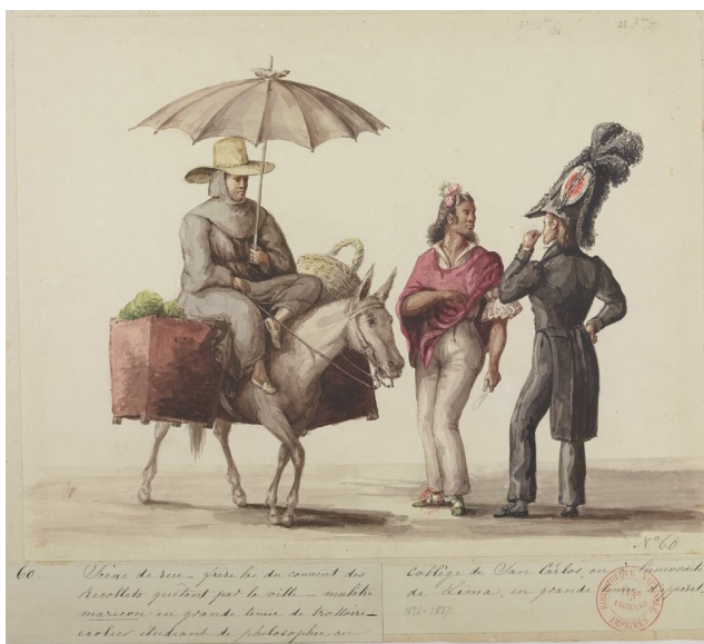
Imagen 6. “Escena en la calle...” (Traducido del francés). L. Angrand. Álbum 1, f. 68. https://gallica.bnf.fr/ark:/12148/bt-v1b10540832f/f68 .

la estadía de Angrand en el Perú que coincide con la ausencia, según sus biógrafos, de Merino en su país natal. El extenso texto con una explicación, así como la seguridad del trazo, nos llevan a interrogarnos sobre la autoría de esta acuarela excepcional, radicalmente distinta de los “maricones” de Pancho Fierro que están también en el álbum—buhoneros de ascendencia africana, vestidos con pantalones blancos, vendedores de flores o de caramelos. 17