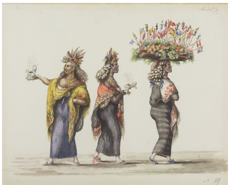
Imagen 5. “Negras y mulatas en gran traje de gala...” (Traducido del francés). L. Angrand. Álbum 1, f. 67. https://gallica.bnf.fr/ark:/12148/btv1b10540832f/f67.item .