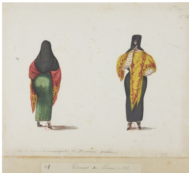
Imagen 1. “Soy de todo un encargado de negocios... guah! – Dames de Lima 1834”. L. Angrand. Álbum 1, f. 18. https://gallica.bnf.fr/ark:/12148/btv1b10540832f/f18.item .

Aparte de la serie de tapadas, el álbum presenta otra imagen recurrente en la producción asociada con Pancho Fierro. Una “India del Valle de San Mateo conduce una llama cargada de carbón” forma parte del primer álbum Angrand. El mismo tipo humano figura en otras colecciones, ya sea como arriera o carbonera, palabras que hacen resaltar el oficio, 14 en lugar de la clasificación por castas heredada del virreinato y de la visión eurocéntrica. El nombre de las piezas que conforman el vestido fue agregado a lápiz por Angrand como un intento de memorizar el vocabulario especializado quechua.