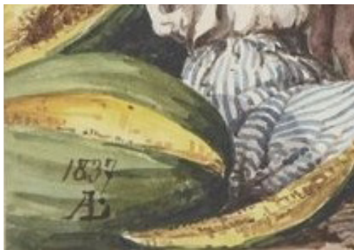
Imagen 7. L. Angrand. Álbum 2, f. 39 (detalle). https://gallica.bnf.fr/ark:/12148/btv1b10540833w/f39.item .

Dos acuarelas del álbum forman parte del repertorio de las representaciones más conocidas del Perú, ya que fueron reproducidas gran cantidad de veces a partir de los álbumes parisinos. La primera es el anuncio de la venta de entradas para una pelea de gallos, fechada el 20 de abril de 1837 19 y cuyo tema también inspiró una cartulina de Pancho Fierro. 20 La segunda es de setiembre de 1837 y representa la vuelta de la fiesta de Amancaes—en una escena más violenta que festiva respecto a las mujeres—como variante del rapto de las Sabinas durante las fiestas populares celebradas en junio, cuando las lomas de Amancaes, cerca de Lima, se cubren de florecillas amarillas, anunciadoras de la San Juan y del inicio del invierno después de los tiempos de sequía.