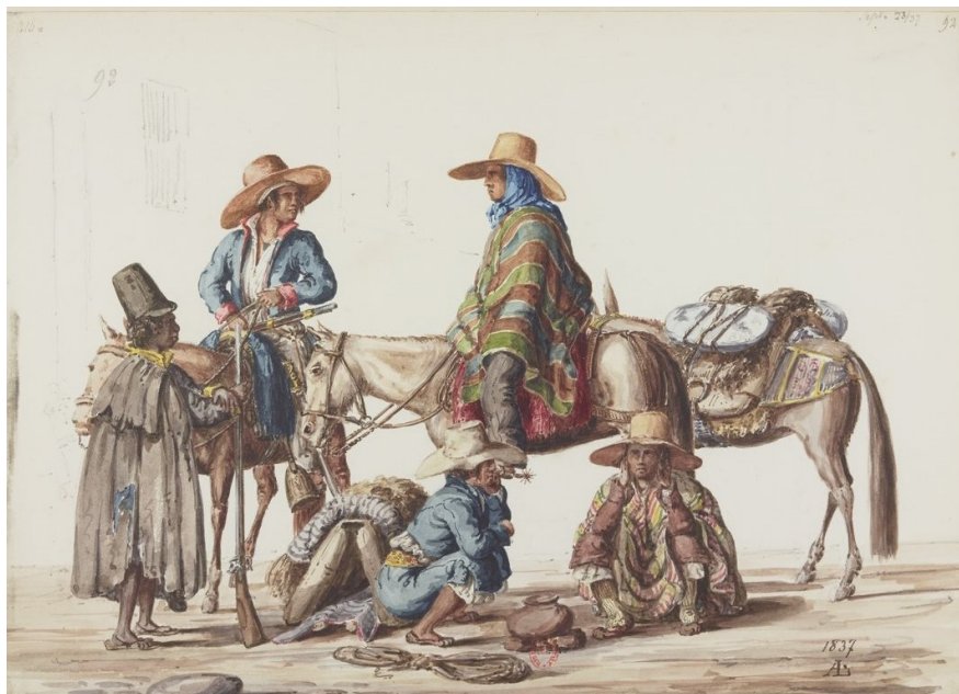
Imagen 11. L. Angrand. Álbum 2, f. 35. https://gallica.bnf.fr/ark:/12148/btv1b10540833w/f35.item .

La miseria es visible al lado del lujo ostensible, que toma la forma de una altísima carroza que cruza la ciudad. 26 Las prostitutas se codean con los dignatarios de la Iglesia en la vía pública. Las procesiones son descritas con gran diversidad. 27 La inseguridad amenaza al viajero en las inmediaciones de la capital. Dibujada por Angrand, Lima se aparenta a la Corte de los Milagros.