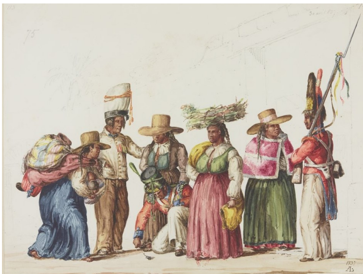
Imagen 9. L. Angrand. Álbum 2, f. 16. https://gallica.bnf.fr/ark:/12148/bt-v1b10540833w/f16.item .