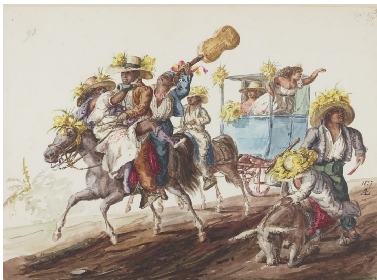
Imagen 8. L. Angrand. Álbum 2, f. 36. https://gallica.bnf.fr/ark:/12148/bt-v1b10540833w/f36.item .

a colorear sus paisajes. Edgardo Rivera Martínez reprodujo parte de ese ingente material paisajístico archivado en las libretas de bocetos en el libro que dedicara al cónsul francés.