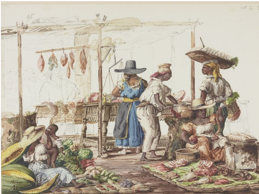
Imagen 10. L. Angrand. Álbum 2, f. 39. https://gallica.bnf.fr/ark:/12148/btv1b10540833w/f39.item .

Los mercados y las tiendas también atrajeron la mirada de Angrand. El diplomático francés representó una ciudad donde abundaba la comida, donde la naturaleza es generosa y donde las madres más humildes viven con sus hijos en un espacio público expuesto a la vista de todos, a diferencia de las señoras que descansan en casonas a salvo de la luz del trópico, y apenas se hacen notar yendo a misa a pie, saludando a los padres omnipresentes en el espacio público y hasta manoseadas por los santos varones. 24 La impudicia de los sacerdotes peruanos ha sido un tema recurrente en los testimonios de los viajeros franceses a lo largo del siglo XIX. 25