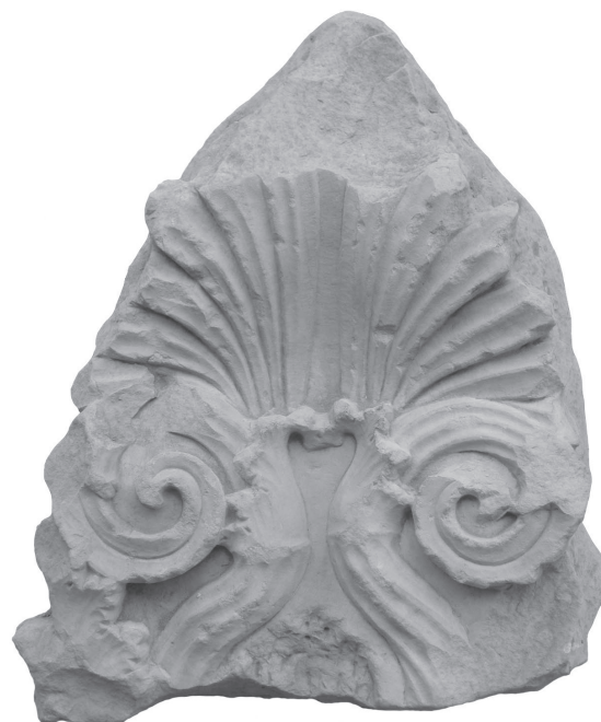
Figure 3 - Fragment de stèle à anthémion MLA 947 = cat. n° 11 ; H cons. 40 cm.

Publ. : Kition III , p. 95-96, n° B 44, pl. XIV, 1 = KB V , p. 184, n° 1074.