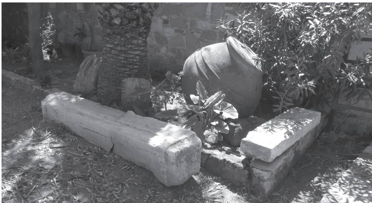
Figure 7 - Stèle-pilier à rosettes. Cour du monastère d'Agios Georgios Mavrovouniou, Troulloi.

Faut-il supposer que les monuments, dont les types varient, ne sont pas contemporains ; qu'un changement de mode, une « hellénisation progressive du goût » fasse préférer les imitations de formes grecques aux simples blocs dressés, en passant par les piliers à pyramidion 51 ? Rien ne permet de l'affirmer sûrement. Une stèle-pilier de provenance inconnue, aujourd'hui conservée dans la cour du monastère d'Agios Georgios Mavrovouniou à Troulloi (au nord de Larnaca, non loin de Kellia, où a été retrouvée la stèle n o 20, remployée dans l'église locale), s'il s'agit bien d'un marqueur funéraire d'époque classique, illustre, de fait, un type parfaitement hybride (figure 7) : le monument, apparemment anépigraphé, a, comme le type phénicien, un corps de section carrée et un couronnement (brisé) que supporte une moulure à rangée d'oves, mais le haut de la stèle est orné, comme le type grec, de deux rosettes.