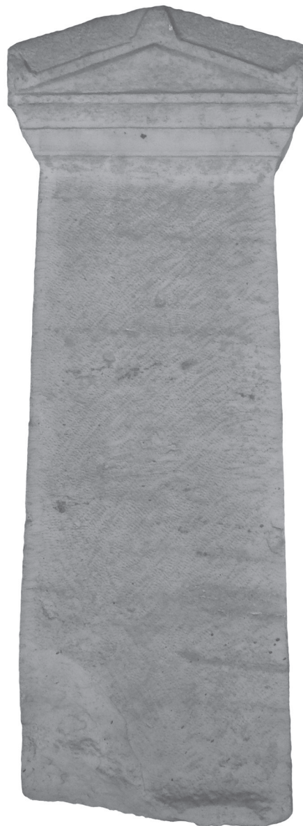
Figure 2 - Stèle MLA 1154 = cat. n° 8, H approx. 80 cm.

La stèle n° 6, qui signalait la tombe d'un fabricant de chariots, porte la représentation gravée d'un outil de charpentier dont H. Matthäus a retrouvé le modèle 22 . La stèle n° 7 est dépourvue d'inscription, mais on peut supposer que la double hache, soigneusement rendue en bas-relief, évoque un autre outil d'artisan (plutôt qu'un symbole, religieux ou guerrier). Le même motif est reproduit sur des stèles du tophet de Carthage 23 . Il ne semble pas qu'il s'agisse d'une herminette, dont la caractéristique principale est la dissymétrie des deux lames, et qui est également bien représentée (et distincte de la hache à double lame) dans le corpus de Carthage et, plus largement en Méditerranée, en particulier sur des monuments funéraires 24 .