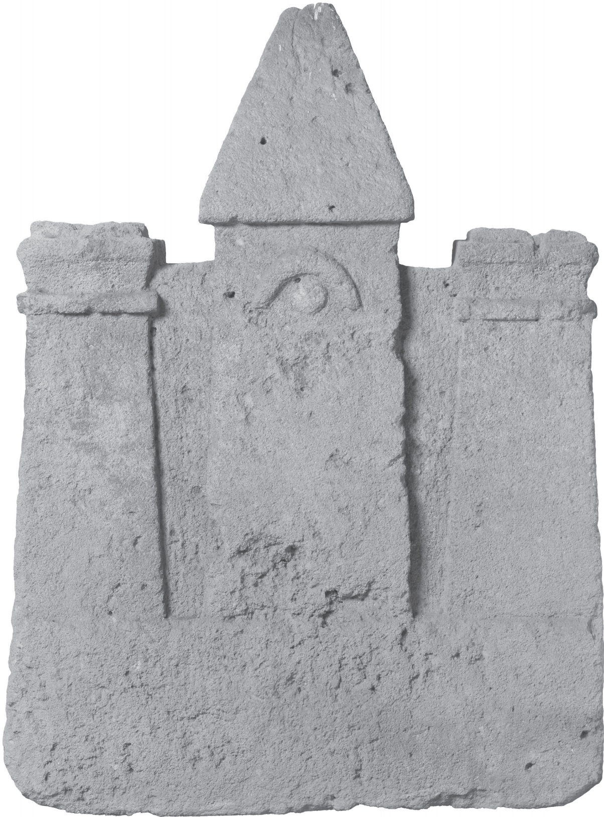
Figure 4 - Cippe de Tharros, H 123 cm (d'après UNALI 2017, p. 422).