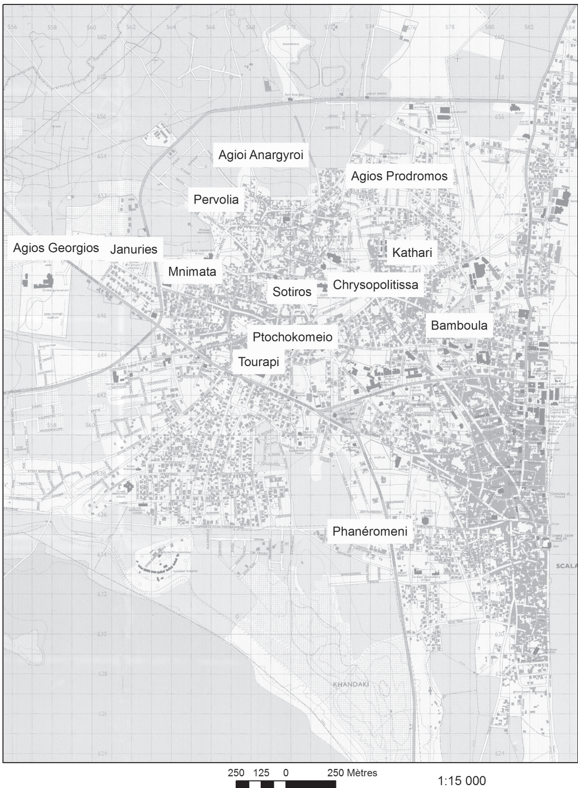
Figure 1 - Localisation des nécropoles de l'âge du Fer de Kition. Le noyau urbain est défini par les sites de Kathari , Chrysopolitissa et Bamboula (élaboration de A. Rabot).