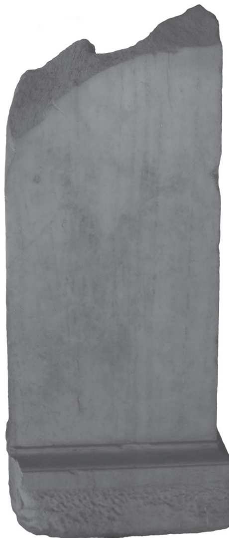
Figure 6 - Stèle-pilier fragmentaire MLA 1150 = cat. n° 23, H cons. 120 cm (cliché mission de Kition, 2009, publié avec l'aimable autorisation du Département des Antiquités de Chypre).

Du point de vue typologique, les bases peuvent être classées en deux groupes : celle à encastrement rectangulaire (qui probablement supportait une stèle à anthémion de type grec) et celles à encastrement carré (qui supportaient des stèles-piliers).