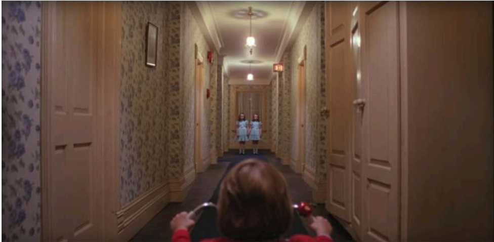
Fig. 2. Stanley Kubrick, Shining . Danny face aux jumelles Grady