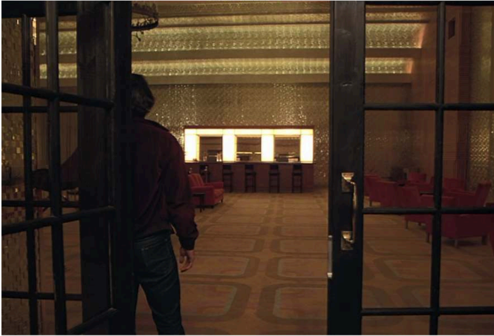
Fig. 3. Stanley Kubrick, Shining . Jack entre dans la Gold Room