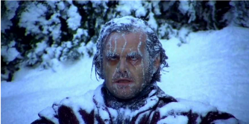
Fig. 8. Stanley Kubrick, Shining . Le cadavre de Jack Torrance dans l' Overlook maze