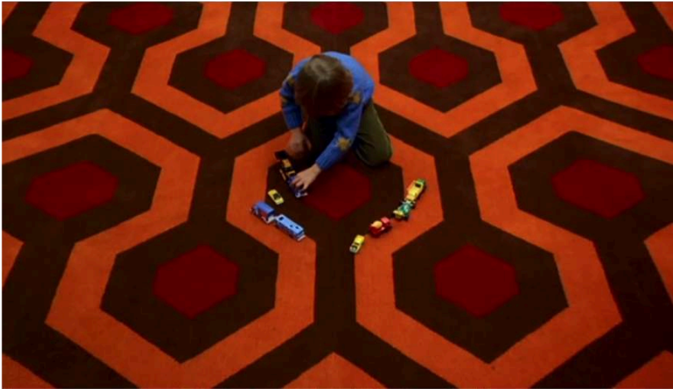
Fig. 10. Stanley Kubrick, Shining . Les motifs de la moquette de l'Overlook