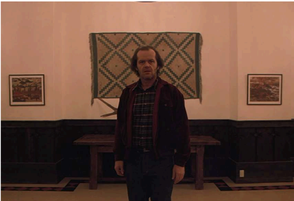
Fig. 7. Stanley Kubrick, Shining . Jack près de la Gold Room