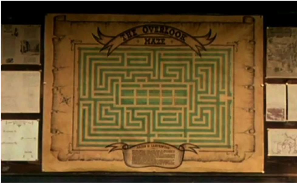
Fig. 12. Stanley Kubrick, Shining . Le plan de l'Overlook maze