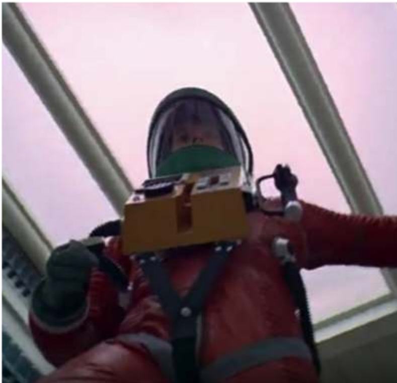
Fig. 1. Stanley Kubrick, 2001 : L'Odyssée de l'espace David Bowman s'apprête à désactiver HAL 9000 / Contre-plongées