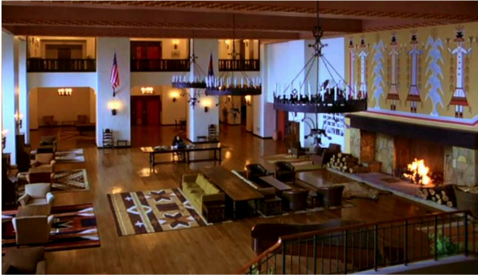
Fig. 6. Stanley Kubrick, Shining . Le motif visuel de la répétition des objets