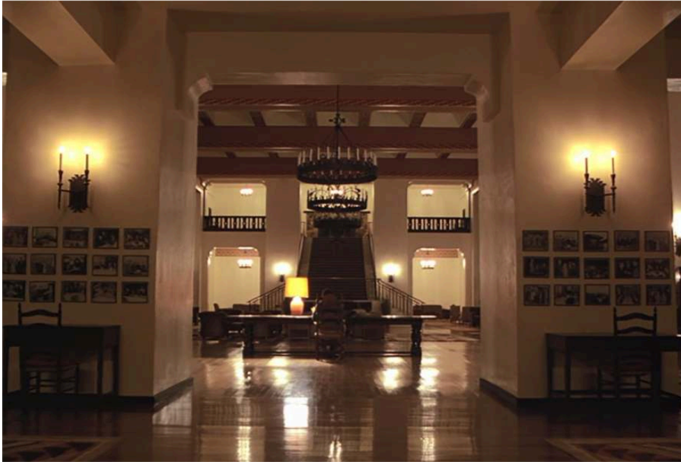
Fig. 11. Stanley Kubrick, Shining . Jack Torrance en train d'écrire.