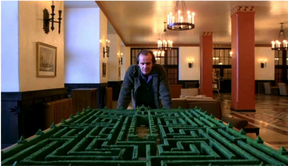
Fig. 4. Stanley Kubrick, Shining . Jack devant la maquette de l' Overlook maze