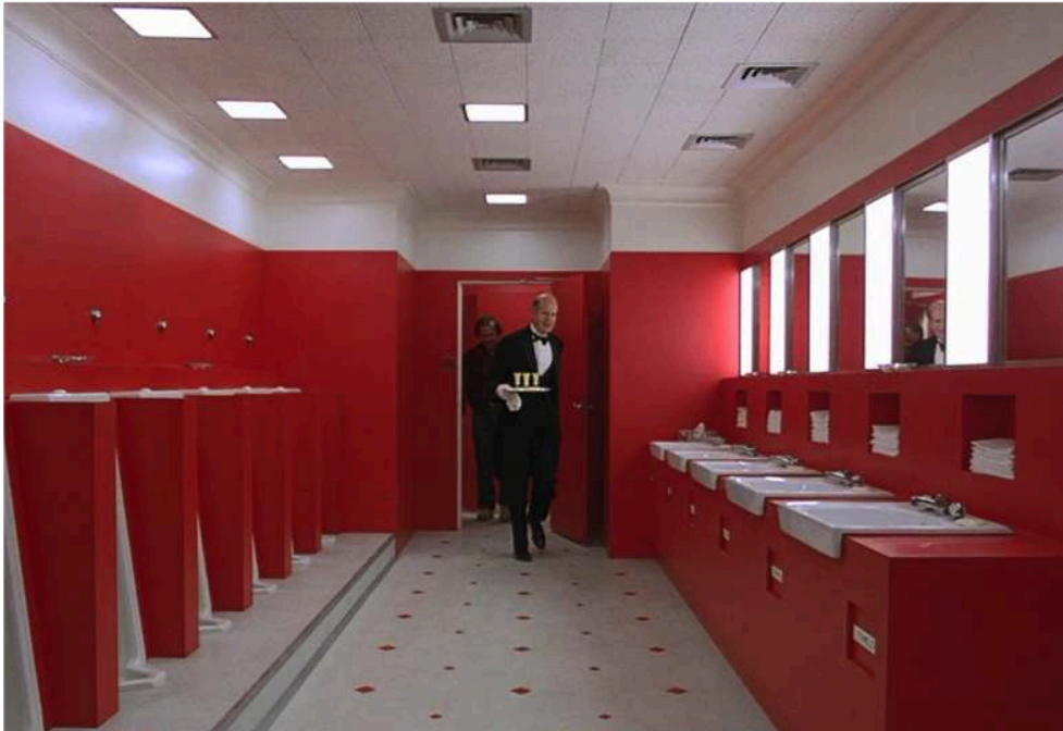
Fig. 9. Stanley Kubrick, Shining . Jack Torrance et Delbert Grady dans les toilettes de la Gold Room