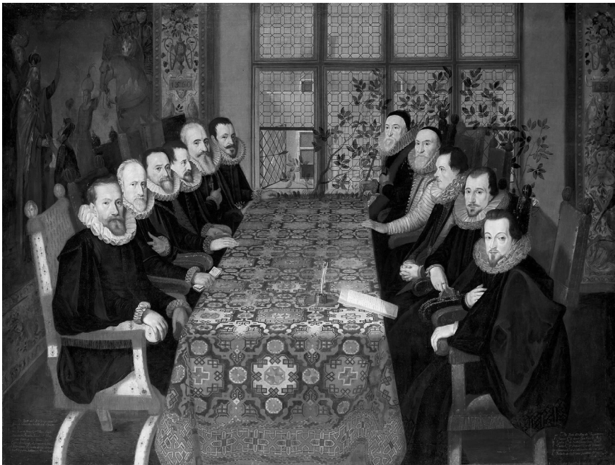
Anonyme, The Somerset House Conference, 1604, huile sur toile, 206 cm × 268 cm, National Portrait Gallery, Londres.

Dans ce tableau, faussement attribué à Juan Pantoja de la Cruz, le morceau de dépêche que tient un des agents les plus influents du roi d'Espagne dans les Pays-Bas, le président du conseil privé des archiducs, Jean Richardot, n'est que la suggestion en filigrane du lien de sujétion entre la délégation diplomatique et l'autorité royale de Philippe III, venant légitimer et autoriser comme par mandat exprès ce qui doit se négocier dans le contenu des articles du traité de paix avec les représentants de Jacques I er . Ainsi, le papier d'État, la dépêche et cela y compris dans les représentations du personnel diplomatique tient un rôle mineur, si discret qu'il n'est bien souvent que suggéré. Le papier tient dans ce tableau et dans celui de Tavarone un rôle qui fait signe vers celui qui est censé tenir en main, au sens le plus concret, la circulation des papiers d'État : le pouvoir souverain, en l'occurrence, dans ces deux représentations, Philippe II et Philippe III. Ces deux motifs de l'apparente absence du roi pourtant omniprésent dans le processus de décision, attentif