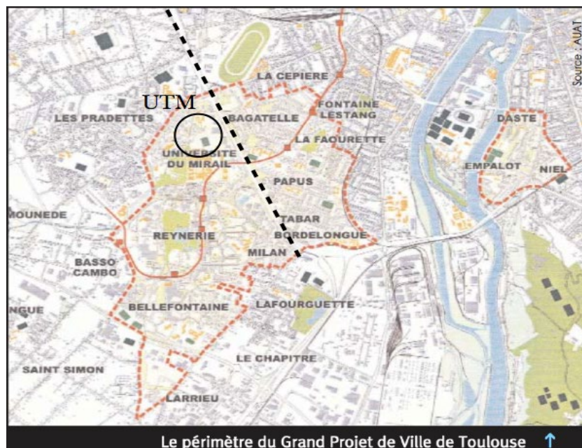
Fig.1 : Périmètre du Grand Projet de Ville de Toulouse

UTM : Université Toulouse Le Mirail (devenue Université Jean-Jaurès en 2014)