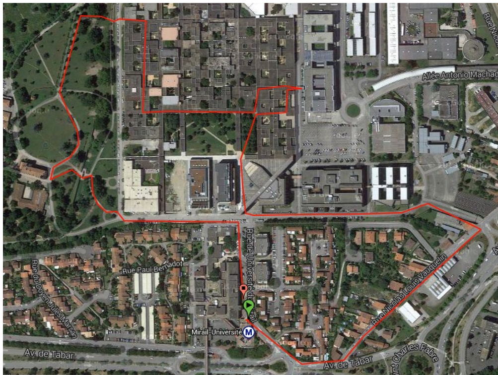
Fig.2 : Itinéraire de la visite du site Mirail Université