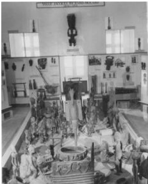
Diamé Chérif, Vue d'ensemble de la salle d'exposition des Arts traditionnels, Musée de Dakar, 1961©ifan sav.

Etablir cette géographie est au cœur du projet photIFAN. Des sciences coloniales au patrimoine africain : cartographier et réévaluer la constellation photographique de l'Institut Français d'Afrique Noire (IFAN) qui sera lancé à l'hiver 2021-2022 57 . Aujourd'hui porté par des institutions basées en France, il s'agira de travailler avec les institutions africaines concernées, afin de pouvoir écrire l'histoire de ces images depuis la France comme depuis l'Afrique. En enquêtant auprès des institutions et des acteurs actuels, il s'agira d'obtenir une vision d'ensemble des lieux où se trouvent ces images et de permettre l'exploration d'une partie de ces photographies via l'élaboration d'outils de recherche numériques relevant du web sémantique. Cette réalisation ne sera sans doute que la première étape d'un projet plus