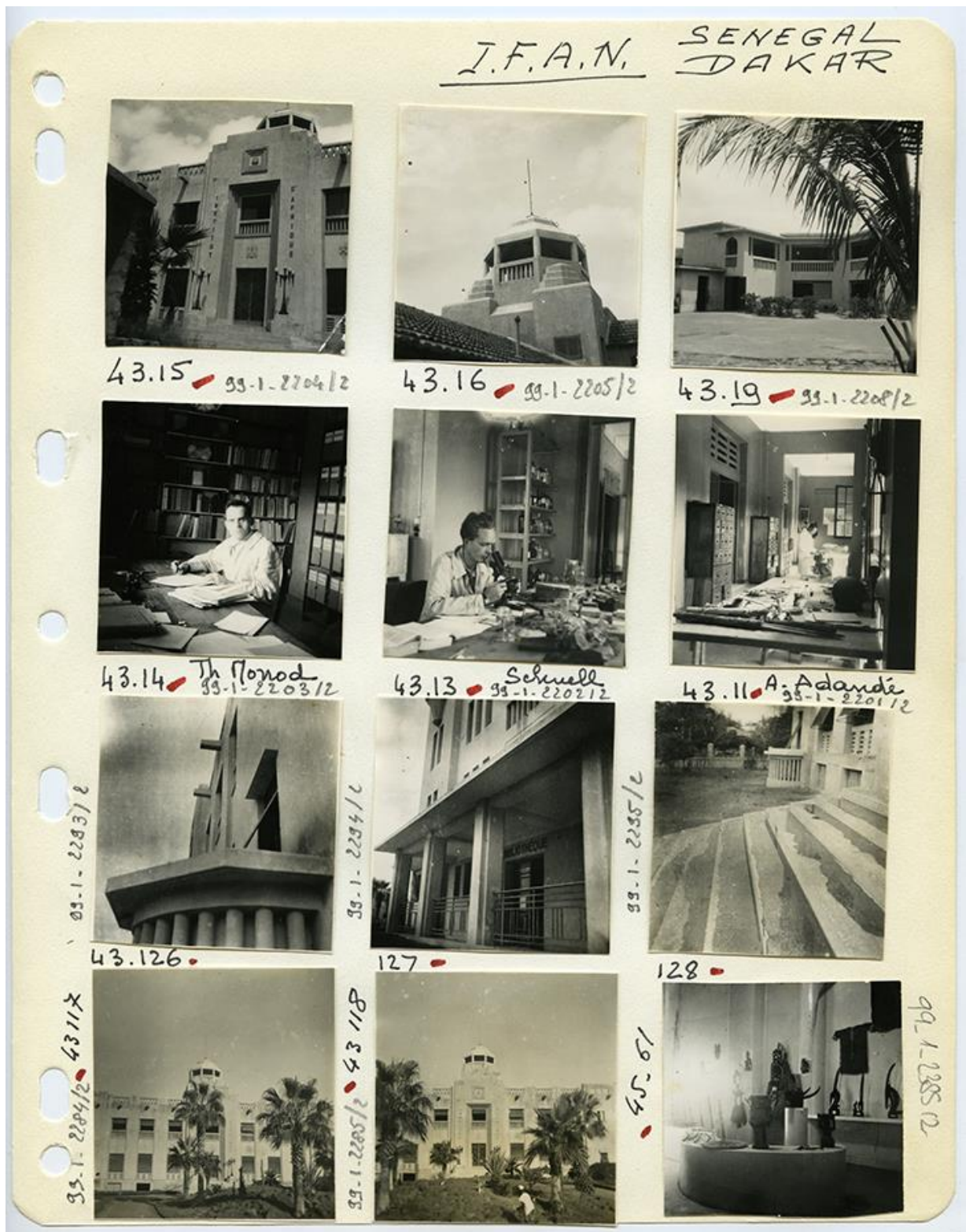
Georges Duchemin, Classeur Sénégal Dakar, page 21, 1943. Musée d'Aquitaine_Fonds Duchemin.