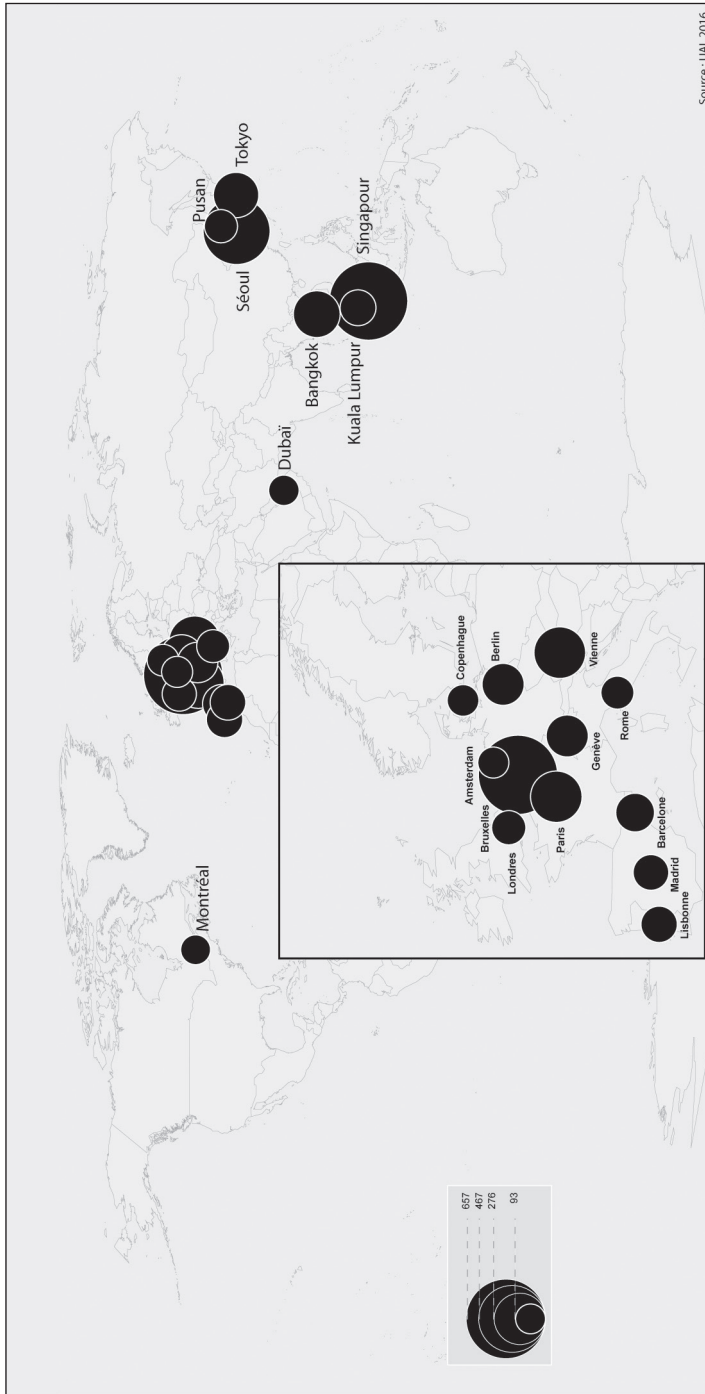
Figure 10.4 – Les 20 premières villes d'accueil de congrès internationaux UAI en 2015