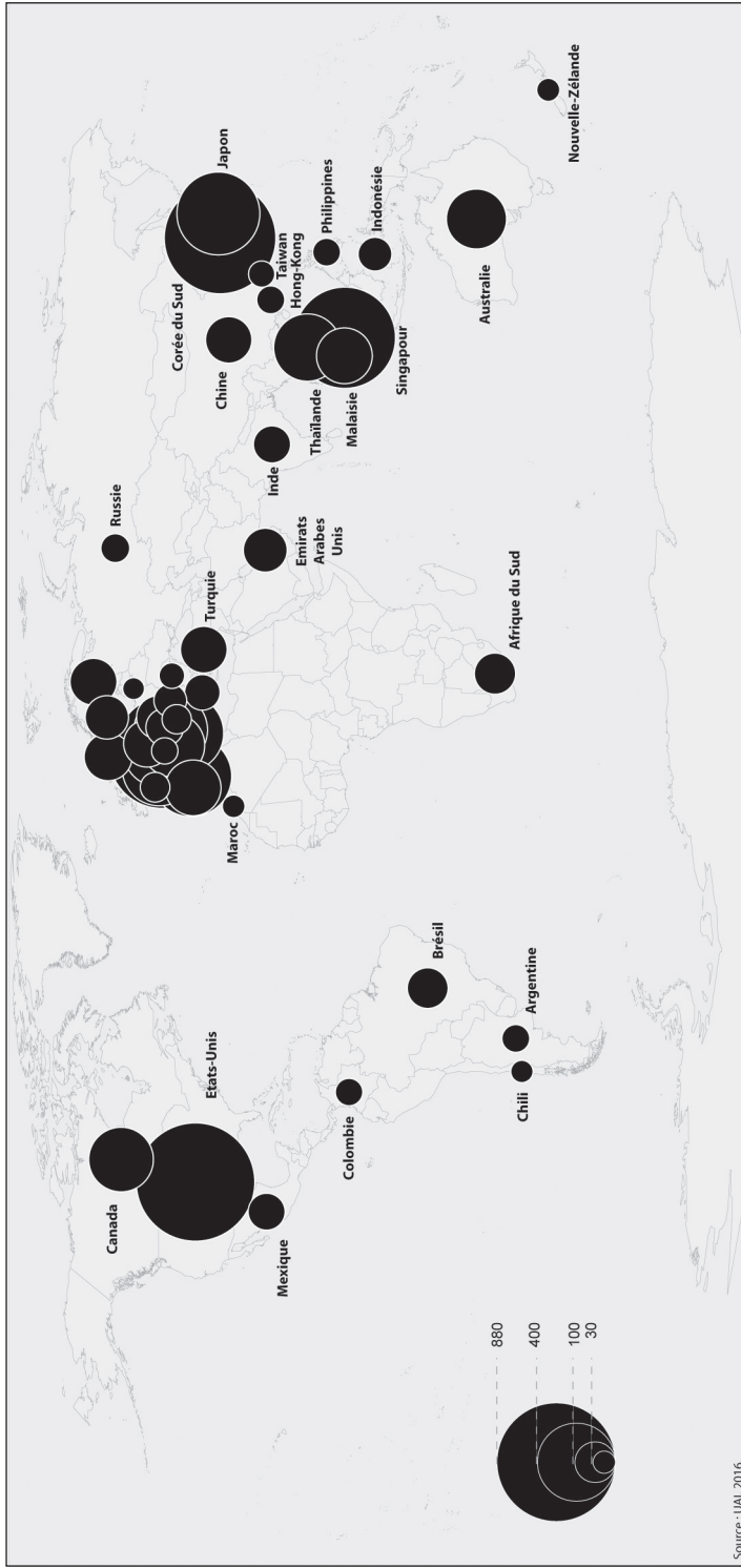
Figure 10.2 – Pays d'accueil des congrès internationaux UAI en 2015 – seuil de représentation 30.