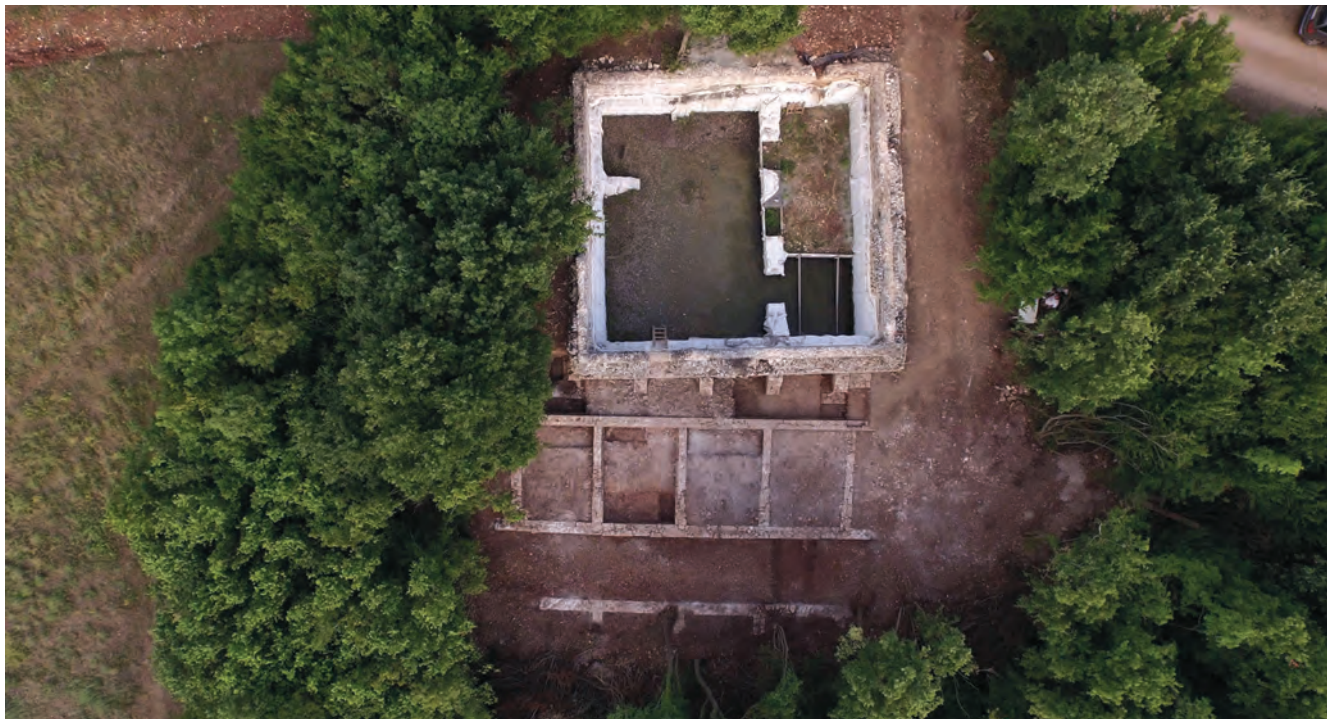
Cisterna i radioničke zgrade 2015. / La citerne et les bâtiments de service en 2015