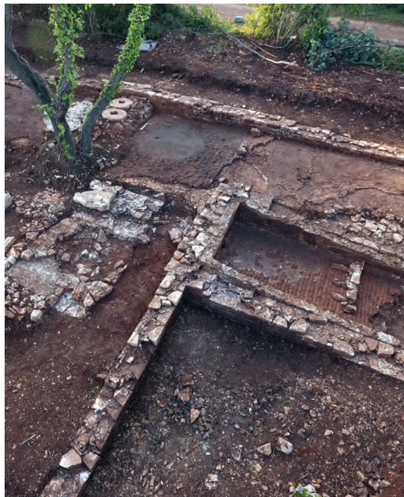
Velika uljara, s dva tijeska, napuštenim mlinovima i izduženim bazenom za dekantaciju / La grande huilerie, avec ses deux pressoirs, les meules abandonnées et un long bassin de décantation.

Kvalitetna izgradnja, opremljenost i površina ovog kompleksa svrstavaju vilu u uvali Santa Marina među najveće priobalne rezidencije rimskog vremena u Istri. Nalazi (novac, staklo, brončani predmeti, keramika) ukazuju da je vila izgrađena na samom početku 1. st. pos. Kr., s posebno izraženom aktivnošću krajem 1. st. pos. Kr., kad je cijeli posjed prešao u carsko vlasništvo. Nažalost su zgrade u potpunosti uništene tijekom kasnoantičkog razdoblja (4.–5. st. pos. Kr.) zbog odnošenja građevinskog materijala kao i cjelokupne dekoracije. Danas samo cisterna, uljara i temelji zgrada, sačuvani i ispod površine mora, svjedoče o toj monumentalnoj građevini, prvotno namijenjenoj boravku vlasnika imanja, a potom predstavnicima carske vlasti.