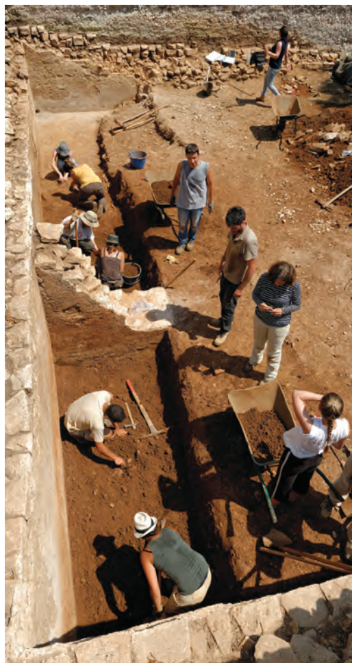
Istraživanja cisterne 2014. / Fouille de la citerne en 2014