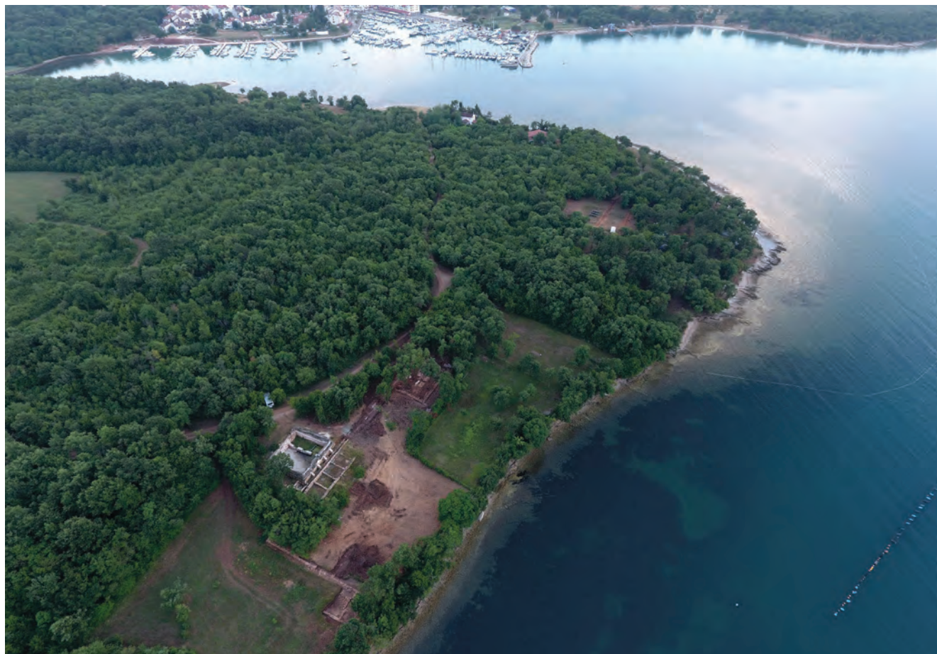
Maritimna vila u Santa Marini 2019. / La villa maritime de Santa Marina en 2019

Smještena na padini i okrenuta prema moru, vila je pokrivala površinu od barem 5000 m 2 . Arheološka istraživanja i sondiranja postupno omogućavaju rekonstrukciju tlocrta građevine, do nedavno prekrivene šumom. Pročelje okrenuto moru, dužine preko 100 m, je djelomično pod vodom. Objekti su se gradili na dvije terase: prva terasa, okrenuta moru, bila je namijenjena rezidencijalnim prostorijama. Najluksuznije sobe su vjerojatno bile raspoređene oko vrta ili peristila, kojeg se može prepoznati zahvaljujući geofizičkim istraživanjima. Te su prostorije nažalost loše sačuvane. Na drugoj terasi, sa sjeverne strane, nalazili su se objekti namijenjeni radnim aktivnostima i služinčadi, dok je na južnoj strani bila uljara s dva tijeska i mlinovima čije je mlinsko kamenje napušteno na licu mjesta.