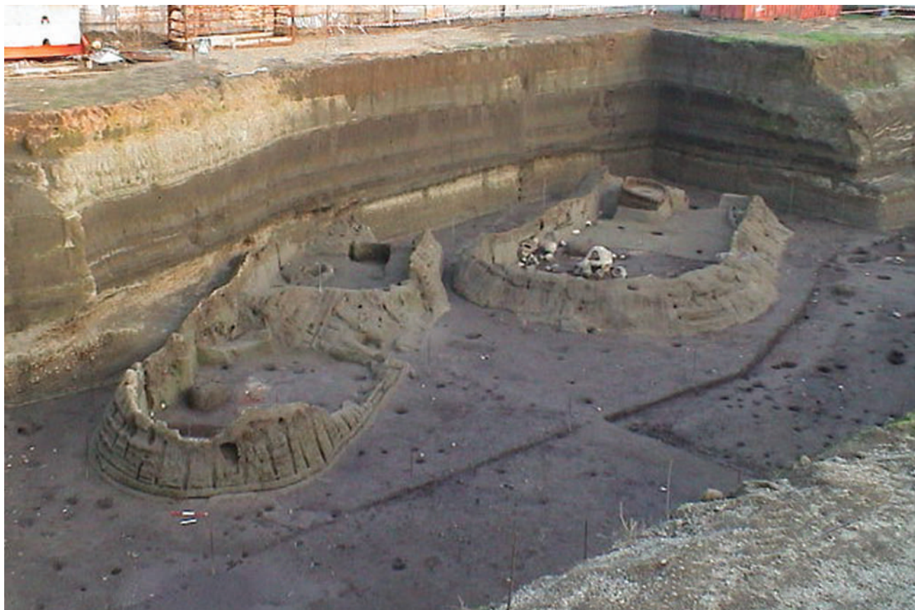
Fig. 2 – Les deux cabanes 3 et 4. Au premier plan, la cabane 4 et la paroi ouest ployée sous l'effet de la déferlante.

intervention incisive de la Préfecture de Naples, au milieu des années '90, a permis de préciser certains aspects liés à l'organisation du territoire et à sa gestion (élevage, culture, typologie des champs cultivés, etc.). Une approche de l'aspect physique de la population en l'absence de l'étude des tombes, quasi absentes 4 – études paléanthropologiques et paléopathologiques, y compris celles de l'ADN 5 – était rendue possible grâce à la découverte des restes de deux fugitifs, morts asphyxiés durant les premières heures de l'éruption à San Paolo Belsito (1995). Au cours de ces mêmes années, les "Grands Travaux", soit la réalisation de projets de grande ampleur sur l'ensemble du territoire, ouvraient une saison exceptionnelle pour l'archéologie campanienne grâce, enfin, à la mise en place d'une archéologie préventive : de vastes zones prospectées et fouillées en vue de la construction de lignes ferroviaires