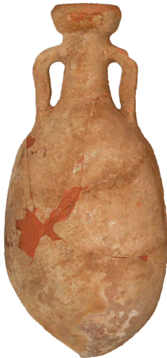
Loronska amfora za maslinovo ulje tipa Dressel 6B / Amphore à huile de Loron, de type Dressel 6B