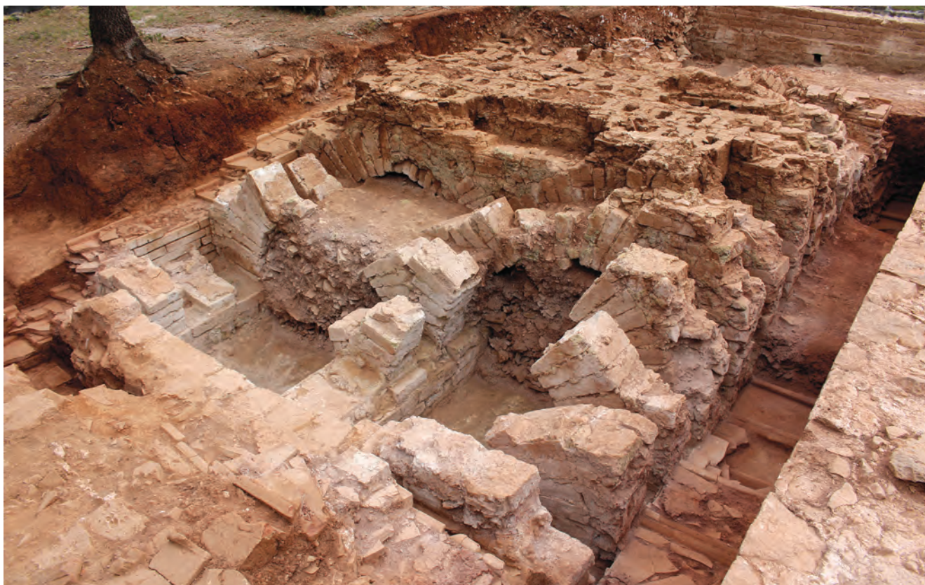
Peć za amfore iz Lorona, otkrivena 2017. / Four à amphores de Loron, découvert en 2017