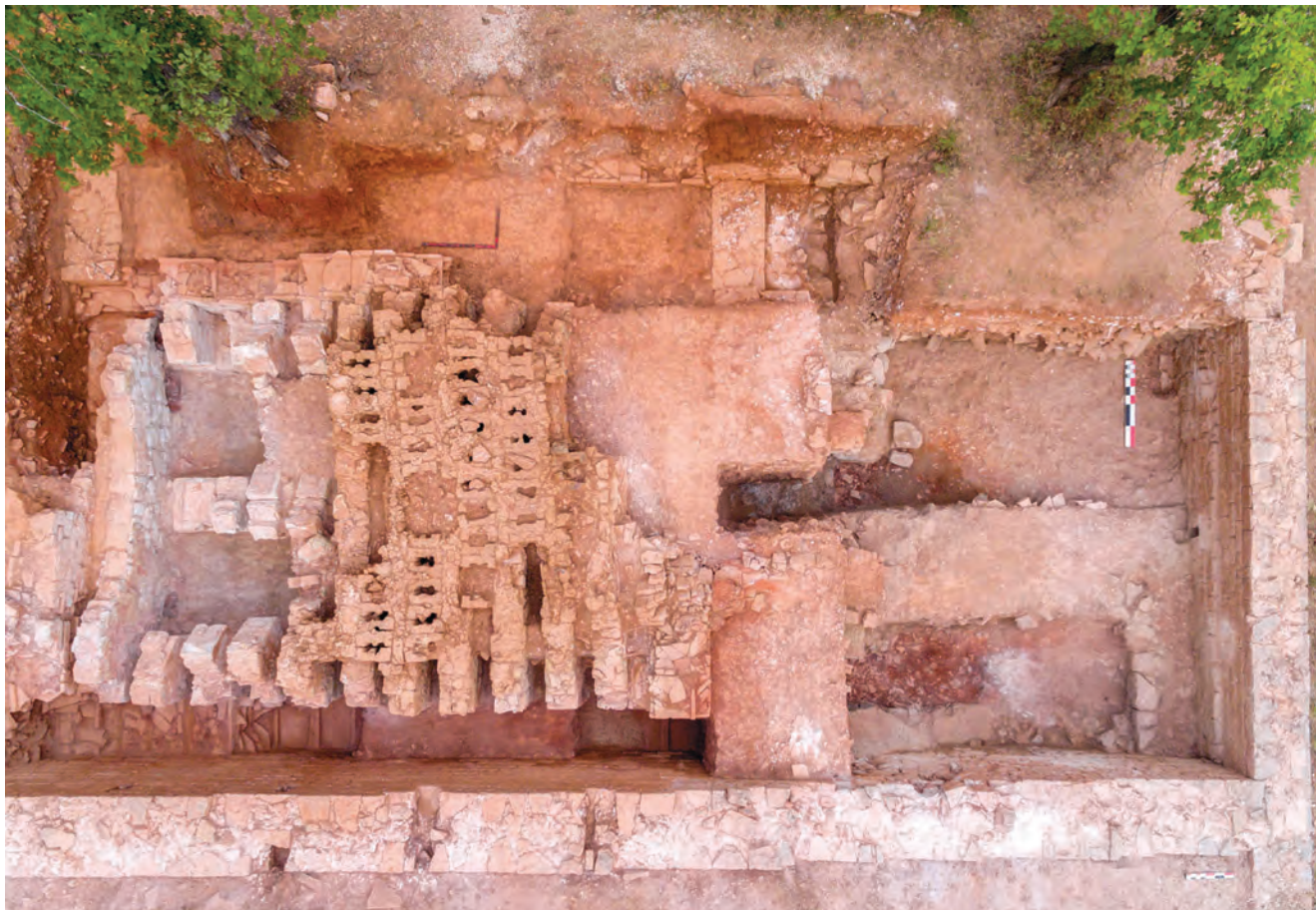
Peć za amfore iz Lorona, otkrivena 2017. / Four à amphores de Loron, découvert en 2017