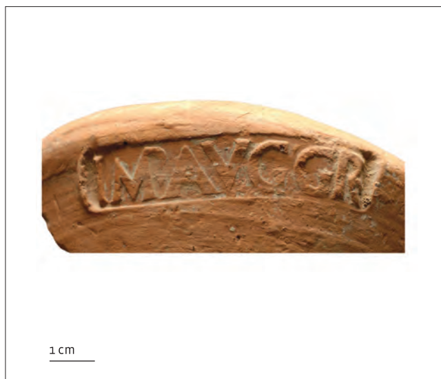
Pečat Sisene Statilija Taura na loronskoj amfori / Timbre de Sisenna Statilius Taurus sur les amphores de Loron Izradio / DAO. L. Dammelet, AMU, CNRS, CCJ