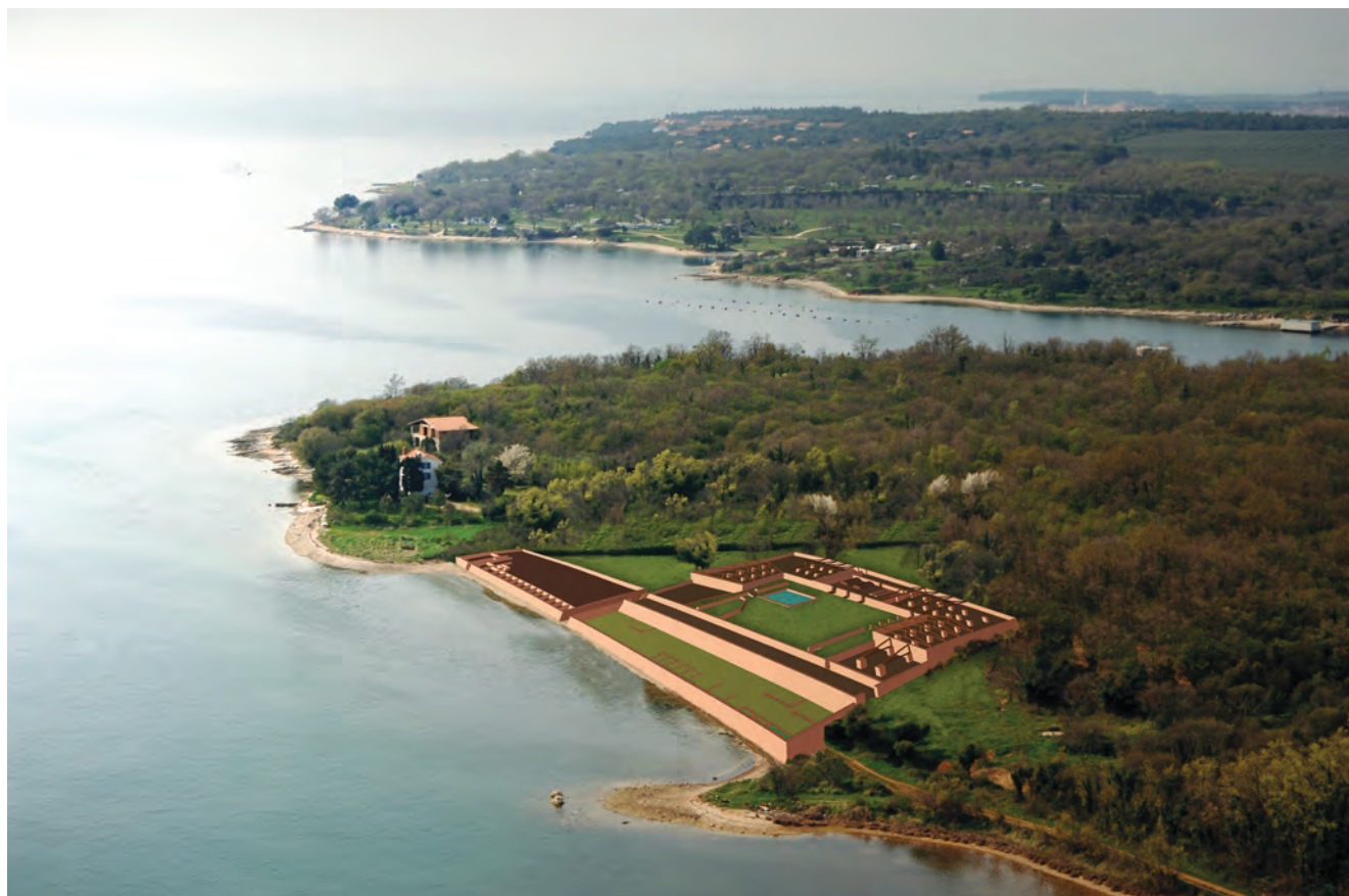
3D rekonstrukcija radioničkog kompleksa u Loronu / Restitution 3D du complexe artisanal de Loron A. Scarpa i A. Marchiori (Sveučilište u Padovi), po fotografiji / sur un cliché photographique de R. Kosinožić

L'étude de ce vaste domaine est au cœur d'une longue collaboration franco-croate, lancée en 1994 par le musée territorial du Parentin / Zavičajni muzej Poreštine avec le laboratoire Ausonius de l'université de Bordeaux Montaigne. Elle a ensuite été élargie à d'autres partenaires, dont l'université de Padoue et l'Ecole française de Rome. Depuis 2012, les recherches se poursuivent avec le Centre Camille Jullian de l'université d'Aix Marseille et du CNRS, l'Ecole française de Rome et le ministère de l'Europe et des Affaires étrangères (France), en partenariat avec le ministère de la Culture de la République de Croatie et la commune de Tar Vabriga – Torre Abrega.