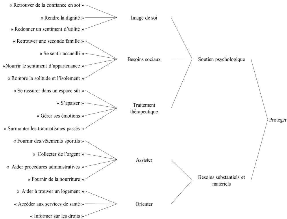
Figure 4 – Conceptualisation de la philosophie politique de « protéger »

Source : Recensement des objectifs des programmes sportifs