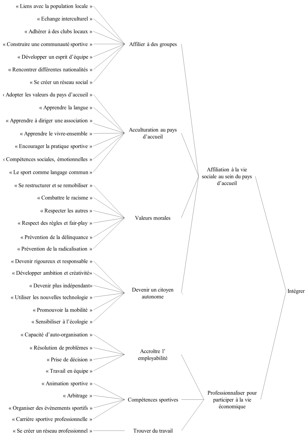
Figure 2 – Conceptualisation de la philosophie politique d’« intégrer »