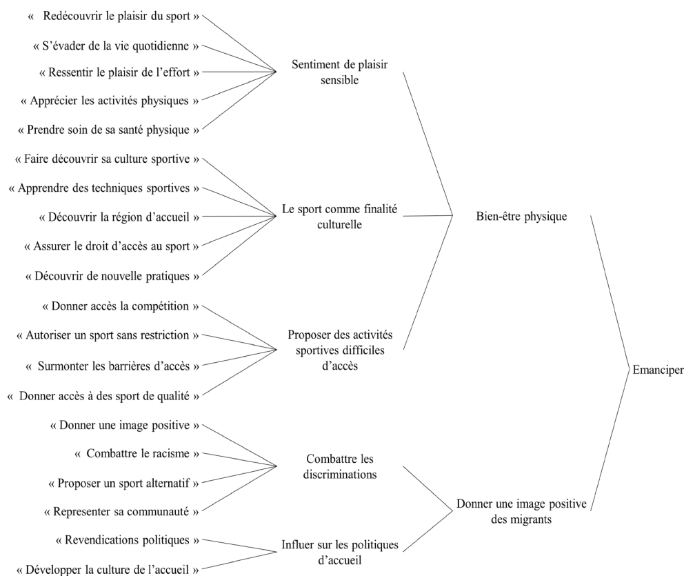
Figure 3 – Conceptualisation de la philosophie politique d'« émanciper »