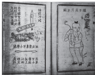
Figure 2. Dans le Livre complet sur les nouvelles méthodes pour extraire la variole ( Yindou xinfa quanshu 引痘新法全書, une réédition de 1864 du texte Yindou lüe écrit en 1817), Qiu Xi montre les points des méridiens où la lymphe vaccinale doit être insérée dans le bras d'un jeune garçon, ainsi que le couteau employé, appelé « aiguille », et la cuiller d'ivoire pour recueillir la lymphe. Le texte appartient à une collection à Pékin.

ports tels que Canton, où la vaccine est signalée dès 1805 par la publication de la traduction chinoise d'un opuscule sur la technique illustrée écrit par Alexander Pearson, médecin de l'East Indian Company, stationnée à Macao. L'adaptation chinoise de ce texte par Qiu Xi, assistant de Pearson, sous le titre Yindou lüe (bref compte rendu de l'induction de la variole), a paru en 1817 à Nanhai, dans la province du Guangdong 23 . Elle a été rééditée un très grand nombre de fois : les bibliothèques chinoises ont conservé soixante-deux éditions différentes jusque dans les années 1950 (sans compter les copies portant des titres différents ni toutes les éditions perdues...), auxquelles s'ajoute aujourd'hui une version électronique (figure 2).