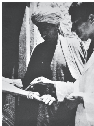
Figure 6. Deux photographies de Paul Almasy, parues dans le magazine OMS Santé du Monde , prises en 1963 lors de la campagne de vaccination contre la variole en Afghanistan. La première représente une femme à la fenêtre de sa maison montrant sa cicatrice vaccinale ; la seconde, une femme tendant son bras à travers un trou du mur de sa maison pour se faire vacciner (ID 25202, ID 25204).

tous leurs soins, en fonction des connaissances – fluctuantes – du moment 46 . À Alma-Ata, l'OMS associait officiellement les