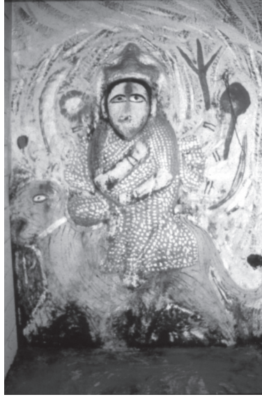
Figure 3. Sitala, la déesse indienne de la variole. Carte postale sans date, Inde.

la mutinerie des musulmans, si la graisse provenait du porc, et des hindous, si elle provenait de la vache. Lorsque la révolte se réclama de l'empereur mogol 31 , les Anglais sentirent passer le vent de la défaite devant la coalition des hindous et des musulmans. Ils ne devaient pas oublier cette leçon. Ils se gardèrent donc d'intervenir désormais trop lourdement en imposant la vaccine, de peur de froisser leurs sujets hindous.