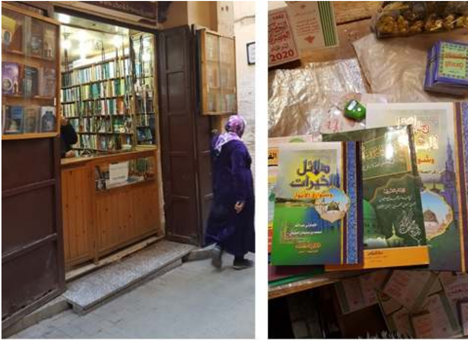
Fig. 12 : Petite échoppe de livres religieux dans la médina de Fès et exemplaires du Dalā'il .