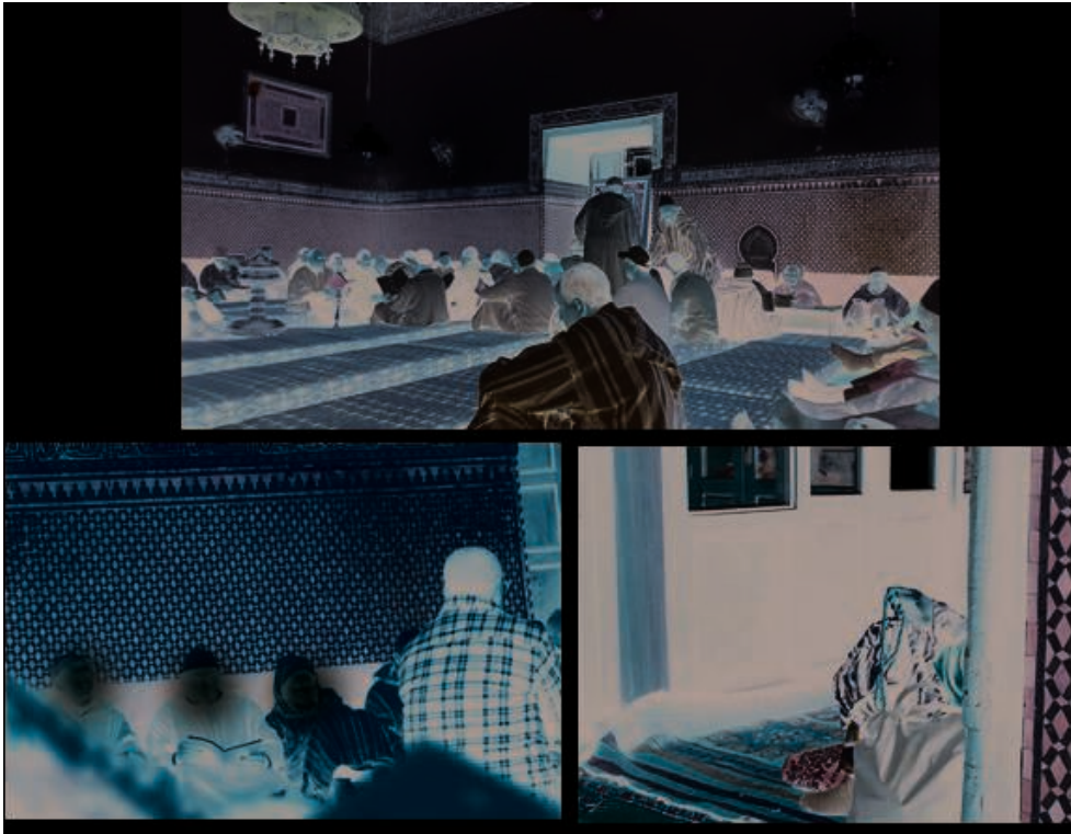
Fig. 11 : Lecture hebdomadaire du Dalā'il al-Khayrāt , menée par les Rijāl al-Dalā'il, au mausolée de Muhammad b. Sulaymān al-Jazūlī à Marrakech.