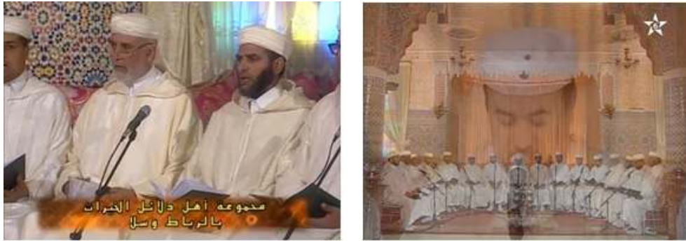
Fig. 10 : Captures d'écran de la transmission télévisée de la lecture intégrale du Dalā'il par l'Association des Gens du Dalā'il al-Khayrāt sur la chaîne Mohammed VI.