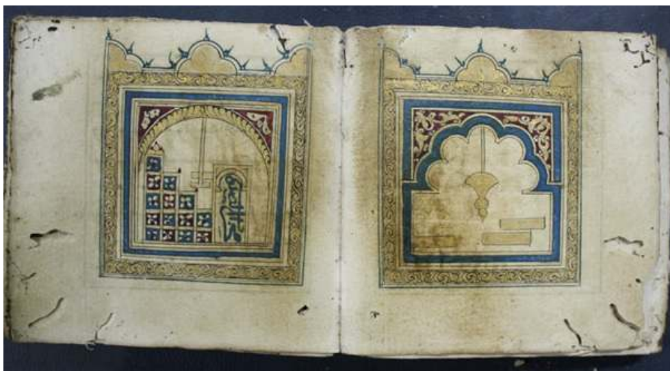
Fig. 3 : Double représentation de la chambre funéraire du Prophète, MS 1642 (XVIII e siècle), Bibliothèque al-Qarawiyyin de Fès.

diagrammatiques. Malgré sa sobriété, il offre un point de vue privilégié sur les tombes et établit une relation sensible entre le corps du Prophète et le lecteur en contemplation (Abid, 2021). Ces images ont par la suite occupé une place cruciale dans le livre, en s'enrichissant de nouveaux motifs évoquant la mosquée de Médine et d'éléments ornementaux colorés et dorés (Fig. 2, 3). Les teintes jaunes, rouges ou bleues et l'or qui colorent la composition sont aussi utilisées dans le programme enluminé du manuscrit. On peut alors penser que l'enluminure guide l'œil du lecteur au fil des pages du manuscrit jusqu'aux images et, de cette manière, allie ses expériences matérielles, esthétiques et religieuses.