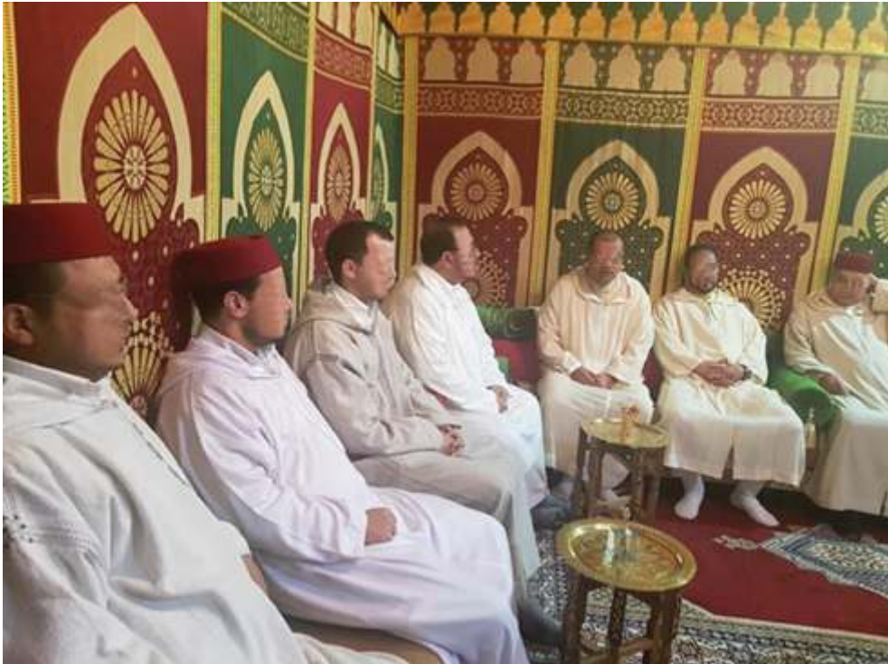
Fig. 9 : Rassemblement des membres de l'Association des Gens du Dalā'il al-Khayrāt dans leur local à Rabat.