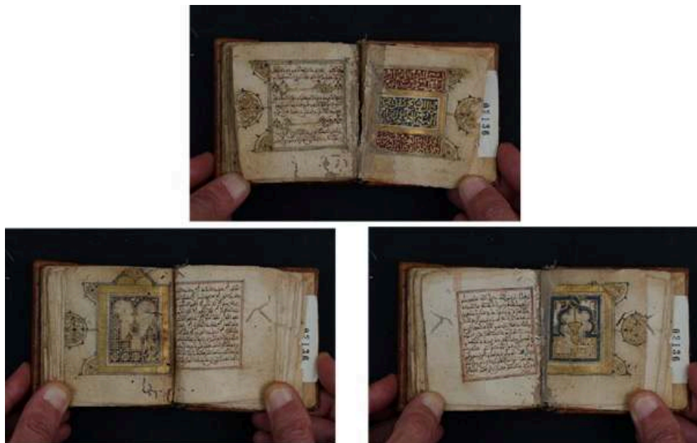
Fig. 2 : Décors enluminés et illustrations dans le MS 2136 (XIX e siècle) de la Bibliothèque nationale de Tunisie.