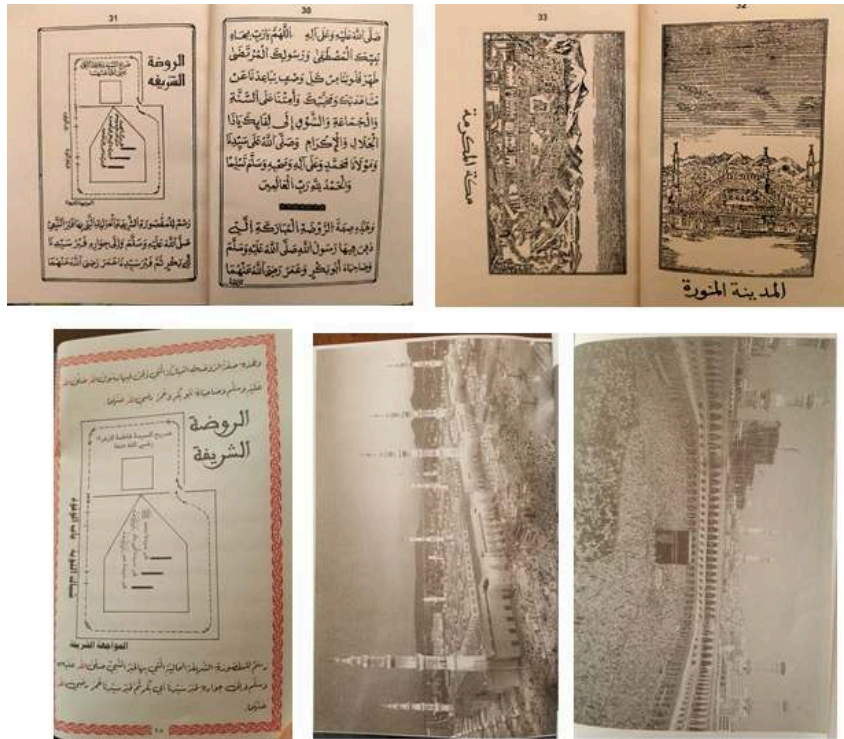
Fig. 6 : Une innovation iconographique dans les imprimés : schéma de la Rawḍa et vues aériennes des sanctuaires de La Mecque et Médine.