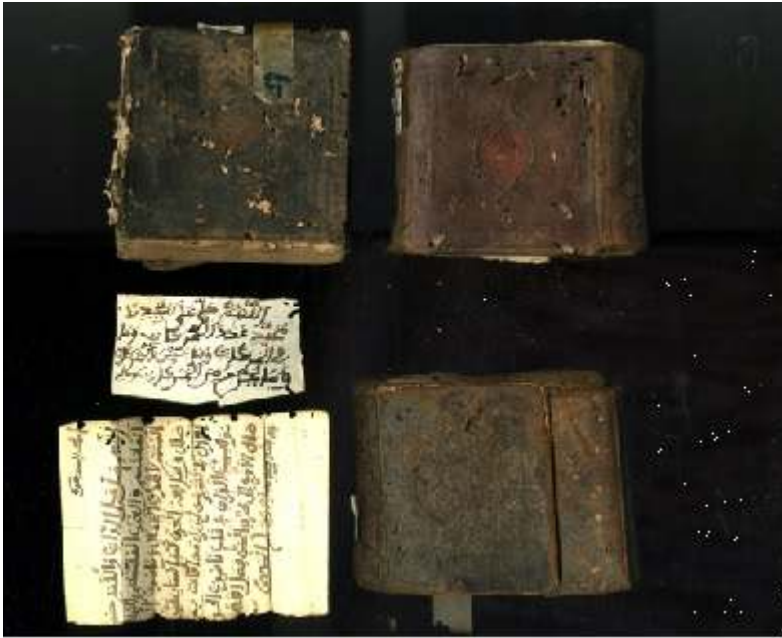
Fig. 1 : Groupe de manuscrits miniatures du Dalā'il al-Khayrāt conservés à la Bibliothèque royale al-Ḥasaniya à Rabat.