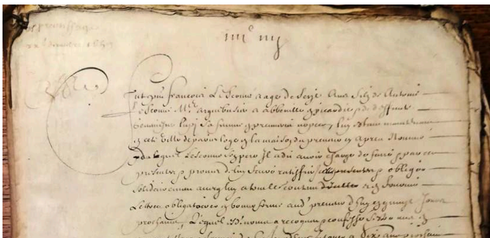
Fig. 1. Le contrat d'apprentissage de François Lescouvé avec Jean Lenfant ( AN, MC, LVIII, 563, 20 DÉCEMBRE 1659 ).