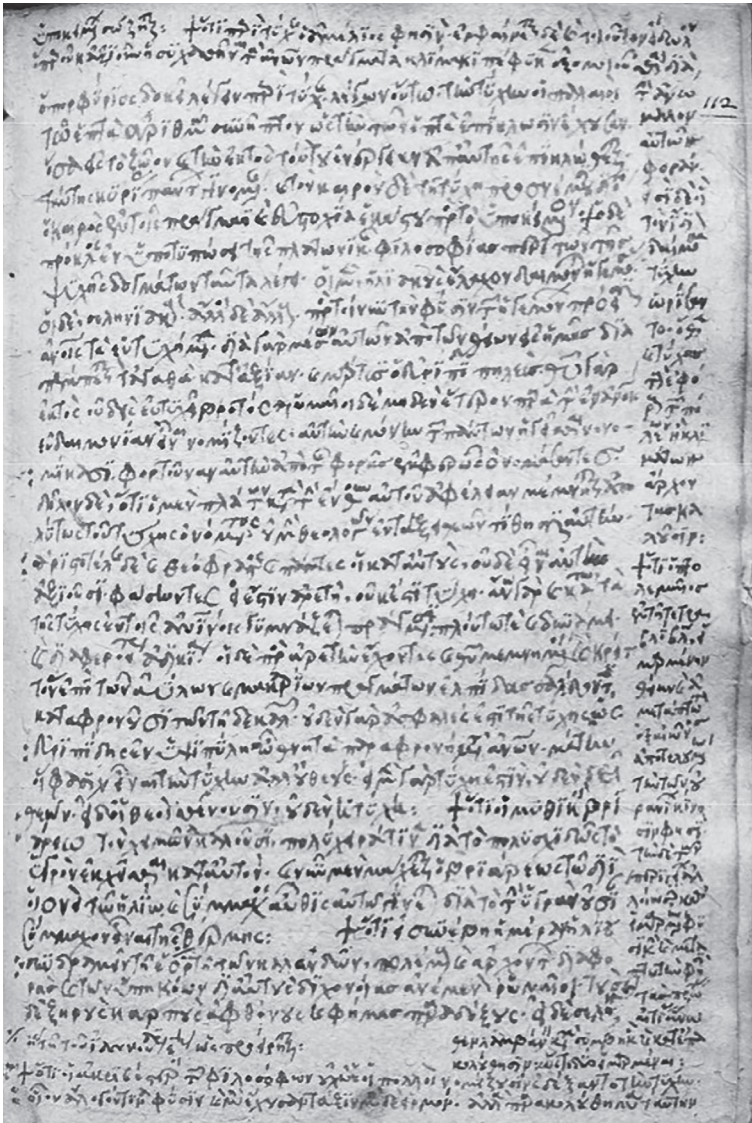
Tafel III: Scorial. Φ.III.11 (S), f. 112r.