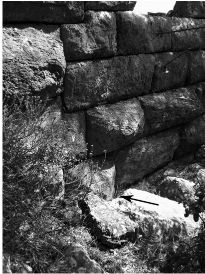
Abb. 2. Fundsituation. Die Nahtstelle ist in der linken Bildhälfte gut sichtbar. Der Pfeil weist auf den Block mit der Inschrift