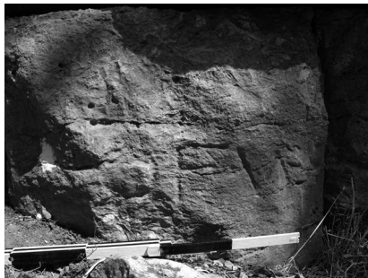
Abb. 3. Inschrift: OFM orm

ßend folgt ein großer Block der Sockelzone. 3 Um wie viel tiefer das Gelniveau zum Zeitpunkt der Errichtung der Mauer lag, ist unklar (Abb. 2). 4