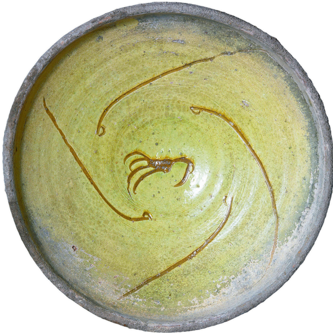
Plat, Chalcis, Grèce, Non daté Terre cuite, 25 × 25 × 9 cm Cité de la céramique - Musée national de Céramique, Sèvres