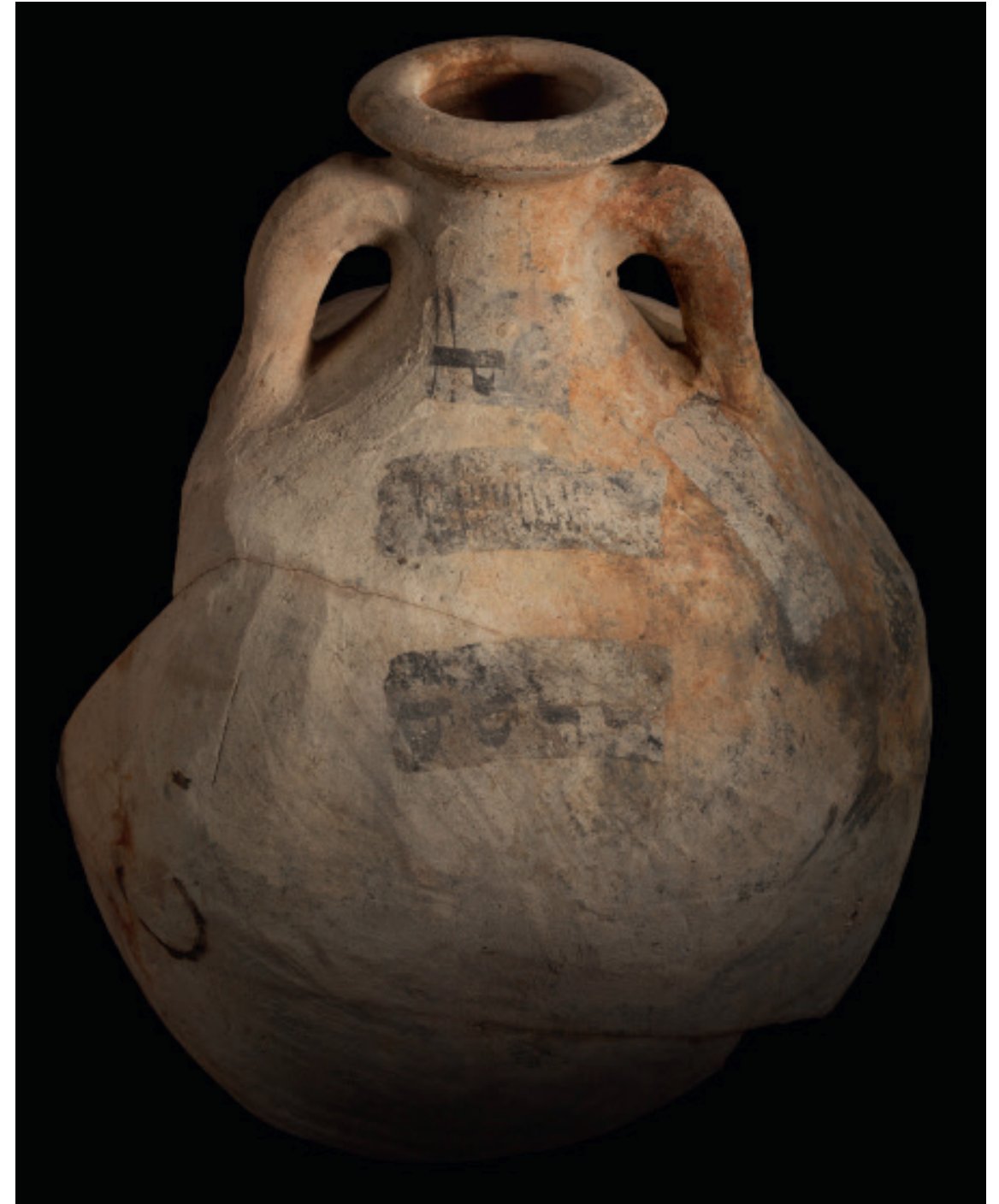
Amphore à huile d'olive de Bétique (Espagne), avec inscription Sans datation Céramique Musée départemental Arles antique, Arles