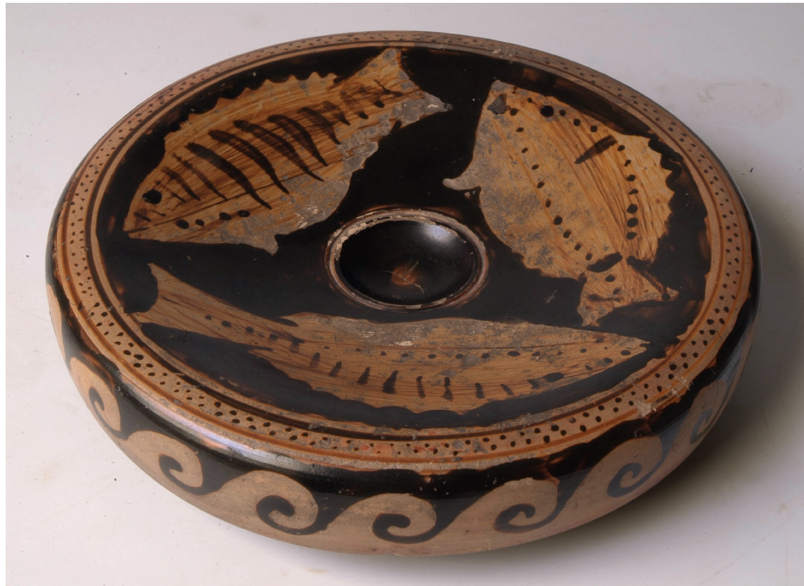
Plat à poisson Paestum, Italie du Sud, 350-325 av. J.-C. Terre cuite, 16,70 × 16,70 × 3,80 cm Musée Saint-Raymond, Toulouse Il est probable que l'on servait du poisson dans ce type de plat. La cupule au centre permet de présenter une sauce ou de recueillir le jus du poisson cuit.