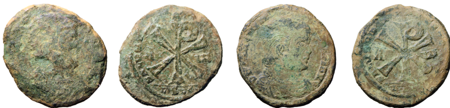
Figure 4 – Deux exemplaires de fausses maiorinae issues des mêmes coins (D1 et R1) découverts sur le site du « Bas des cuves » à Martinville (88) 23 .

pour la période romaine autour des ateliers de faux monnayages et d'imitations romains, dont l'étude de l'atelier de fausses maiorinae de Magnence à Martinville (88) qui est en cours 22 .