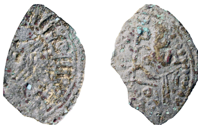
Figure 2 – Argenteus pseudo-impérial découvert dans l'US 283 du site de « L'îlot de la Visitation » à Metz (16 mm ; × 2).

Le développement de l'archéonumismatique permet, à travers ce PCR, de commencer l'exploitation de ces nombreuses données. Nous avons opté pour une étude quasiment systématique des monnaies médiévales et modernes issues des fouilles récentes en débutant par la rétroconversion des données déjà connues. Près de 200 exemplaires ont ainsi rejoint la base de données, et ont permis de compléter ou d'ajuster les référentiels. Pour la période antique, nous nous limitons à la rétroconversion des données et à l'étude approfondie des sites majeurs tels que Grand (88), La Bure (88), Scarponne (54), Nasium (55), Amel (55), Bliesbruck (57) ou encore Metz (57). Plusieurs milliers de monnaies antiques sont déjà intégrées à cette base. Cette approche permettra d'effectuer une synthèse de la circulation monétaire sur près de 2 000 ans. De plus, cela a déjà permis, par exemple, lors de l'inventaire des monnaies découvertes dans les fouilles de Metz 5 d'identifier un argenteus pseudo-impérial généralement daté entre 450 et 530 apr. J.-C. 6 . Cet argenteus est intégré à la thèse en cours de notre collègue Guillaume Blanchet (CRAHAM) ainsi qu'au projet porté par le CRAHAM d'inventaire des Trouvailles d'Argent Monnayé du IV e au VI e siècle dans les provinces continentales du nord-ouest de l'Empire romain (ITAM) 7 .