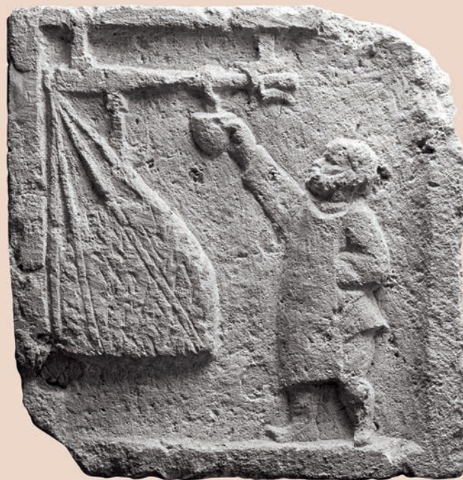
► Stèle funéraire mise au jour à Neumagen, Allemagne. Musée provincial de Trèves.

négoce de lingots métalliques. À Pompéi, un relief, aujourd'hui conservé au musée archéologique de Naples, mettant en scène le travail d'un chaudronnier, montre la pesée du métal sur le plateau d'une grande balance à fléau massif suspendue au plafond de l'atelier par des chaînes. À Sousse en Tunisie, une mosaïque montre une grande balance à fléau suspendue par une chèvre tripode utilisée lors du déchargement d'un navire dont la nature des denrées transportées interroge. L'utilisation de tesselles de teinte jaune-ocre fait penser soit à des pièces de bois, soit à des lingots métalliques oblongs. Malgré plusieurs témoignages figurés, l'utilisation de ces poids était très variée