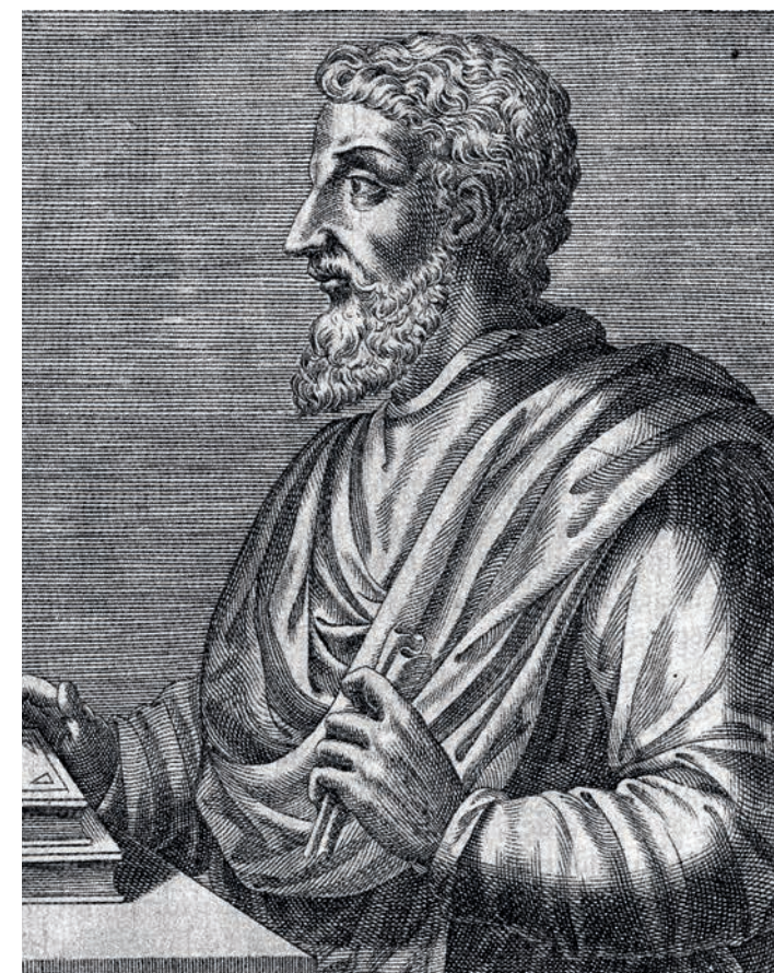
▲ Gravure du XVIII e siècle illustrant l'agronome romain Varron.

un colon ; de l'exécution des différents travaux et enfin des avantages et inconvénients de différents types de cultures. Les domaines considérés par les agronomes répondent tous au modèle de la villa , souvent esclavagiste. Pour cette raison, le lecteur y trouvait aussi des conseils sur la façon d'aménager la pars urbana (la demeure du maître) et sur la meilleure façon de vendre les productions du domaine. Il est en effet aisé de comprendre que la villa des agronomes visait moins à l'autosubsistance qu'à la commercialisation des récoltes, de ce fait choisies pour leur valeur ajoutée. Ce qui distingue les ouvrages des agronomes est la présence ou non de la question de l'élevage, que les Romains séparaient de l'agriculture.