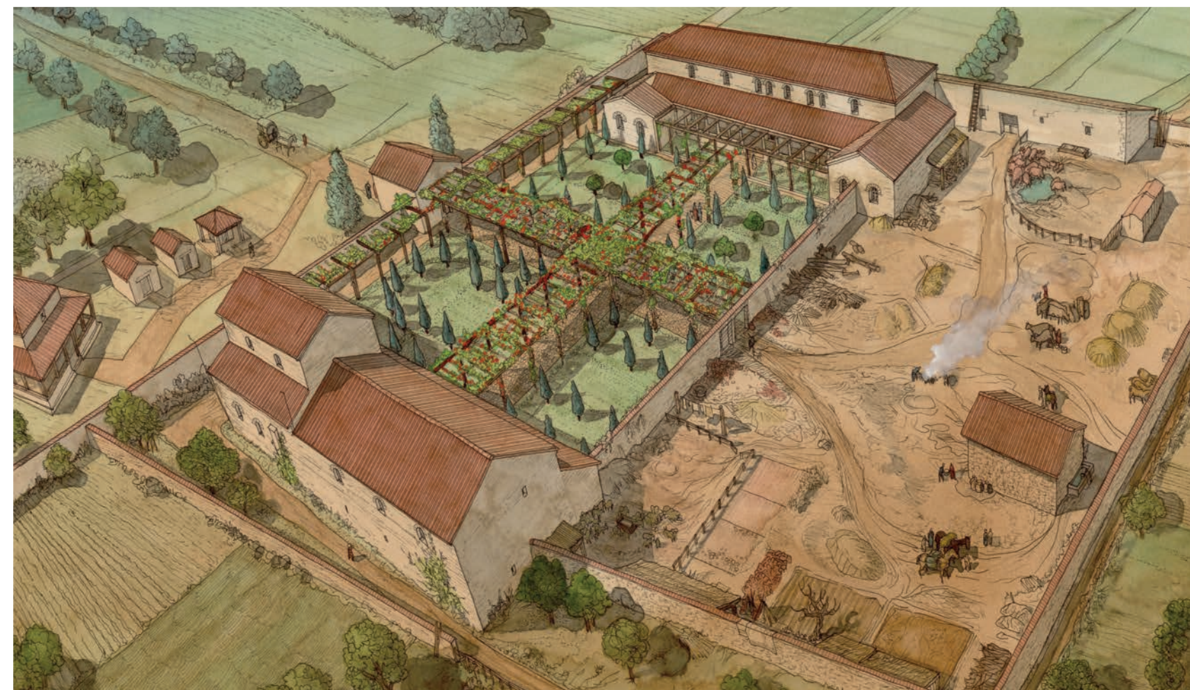
Jean-Claude Golvin, Villa de Richebourg , Yvelines, aquarelle. Musée départemental Arles antique.