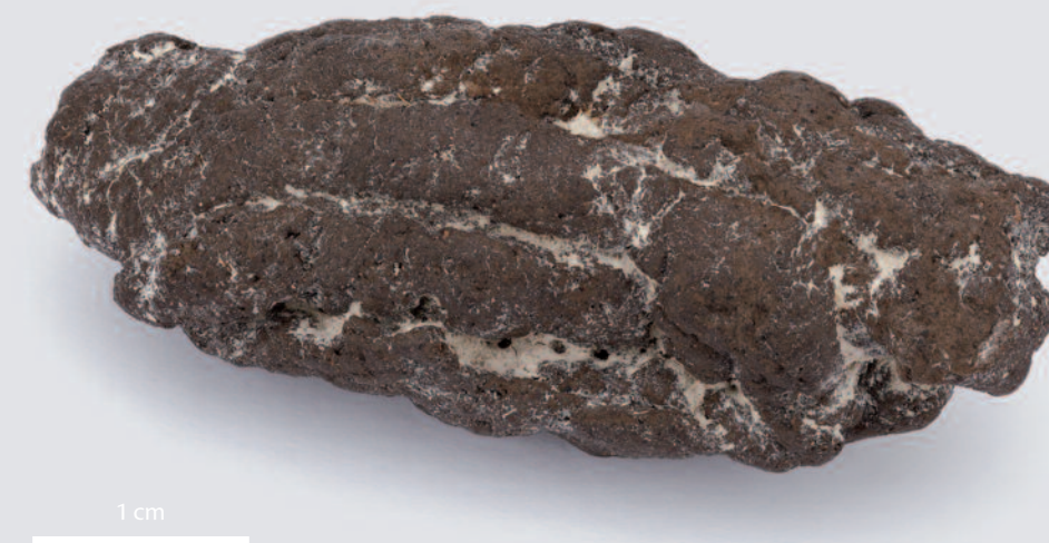
4 - « Chewing-gum » de bétuline (colle de bouleau), Chalain station 3.

Jacomet et al. 2005; Jensen et al. 2019; Kashuba et al. 2019.