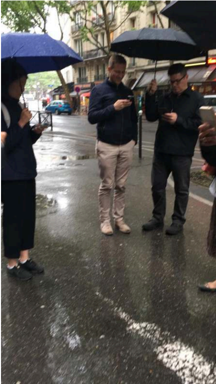
Photographies prises lors de la promenade, Paris, quartier Jussieu, 2018. Cedissia About, 2018.