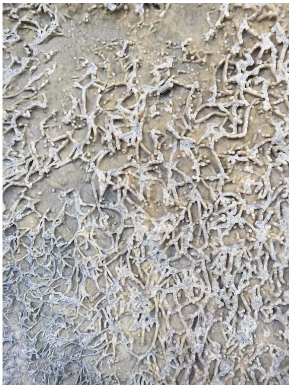
Figure 1. Marbre blanc.

Photographies prises lors de la promenade, Rome, quartier de San Lorenzo, 2018 Cedissia About, 2018.