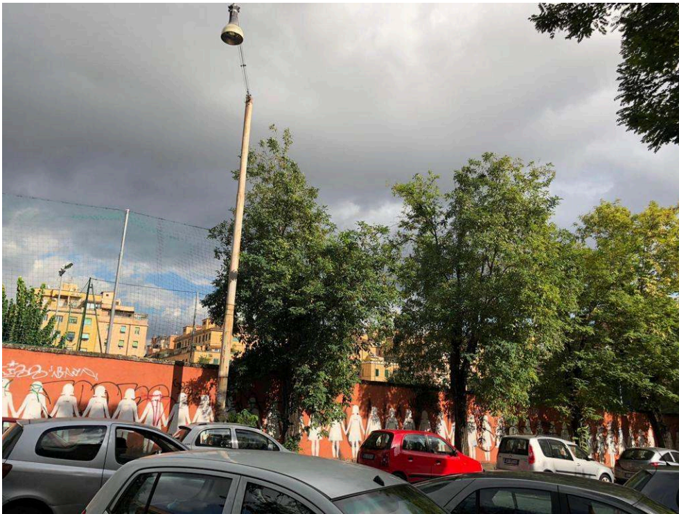
Photographies prises lors de la promenade, Rome, quartier de San Lorenzo, 2018 Cedissia About, 2018.