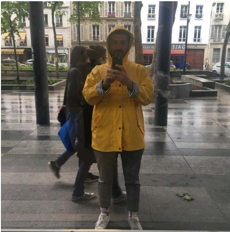
Photographies prises lors de la promenade, Paris, quartier Jussieu, 2018. Cedissia About, 2018.