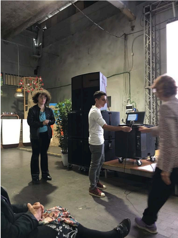
Photographies prises lors de la promenade, Rome, quartier de San Lorenzo, 2018 Cedissia About, 2018.