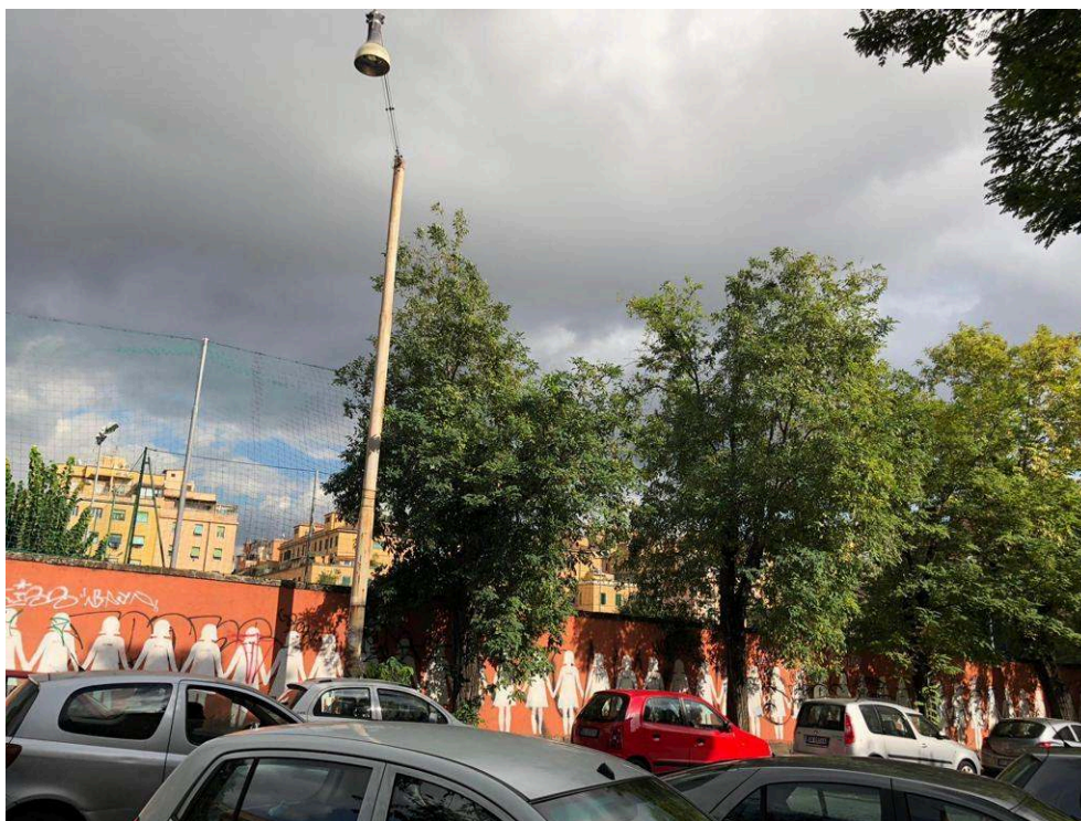
Photographies prises lors de la promenade, Rome, quartier de San Lorenzo, 2018 Cedissia About, 2018.