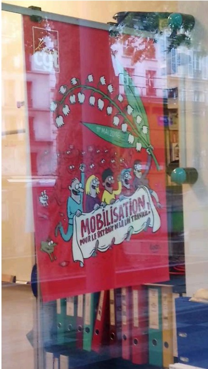
Photographies prises lors de la promenade, Paris, quartier Jussieu, 2018. Cedissia About, 2018.