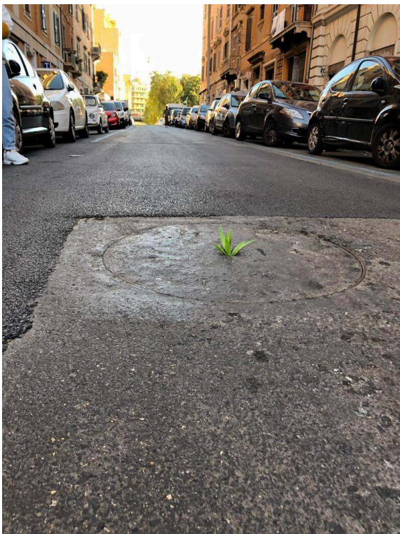
Photographies prises lors de la promenade, Rome, quartier de San Lorenzo, 2018 Cedissia About, 2018.