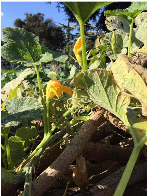
Photographies prises lors de la promenade, Rome, quartier de San Lorenzo, 2018 Cedissia About, 2018.