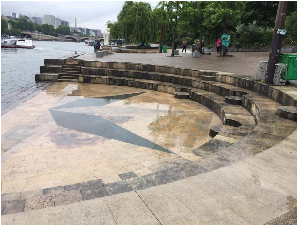
Photographies prises lors de la promenade, Paris, quartier Jussieu, 2018. Cedissia About, 2018.