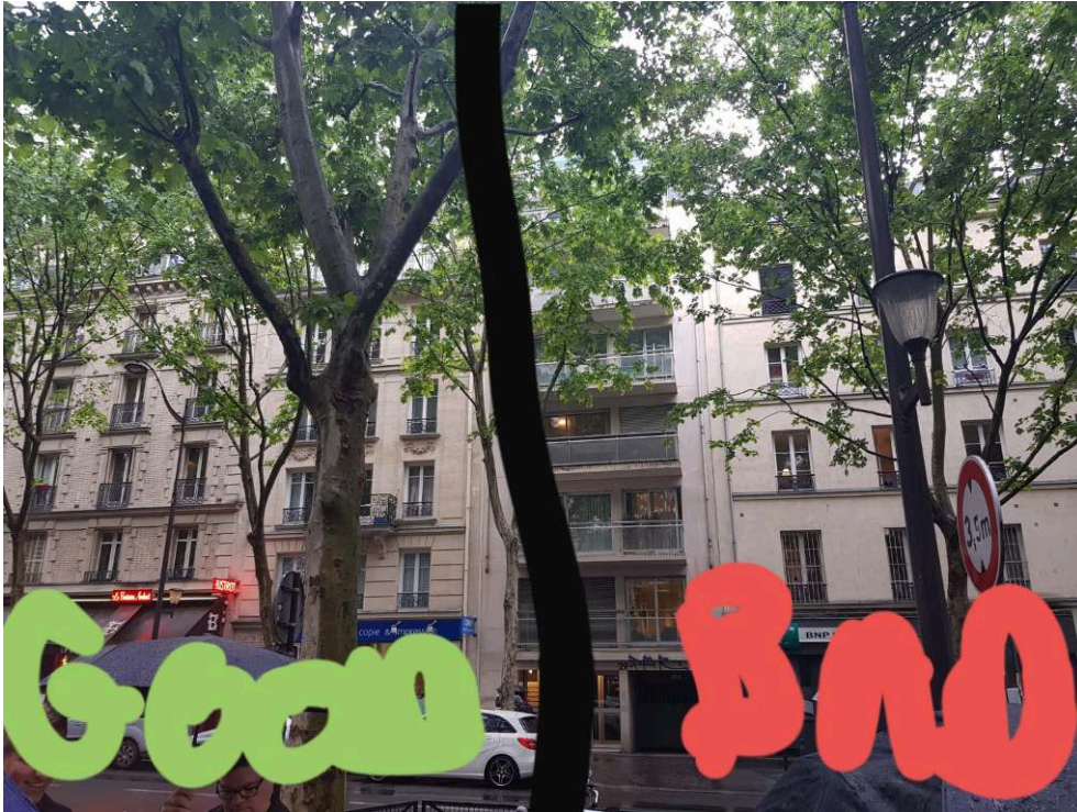
Photographies prises lors de la promenade, Paris, quartier Jussieu, 2018. Cedissia About, 2018.