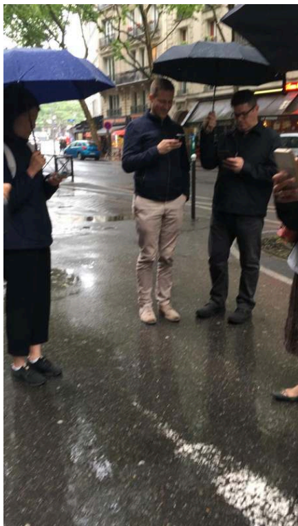
Photographies prises lors de la promenade, Paris, quartier Jussieu, 2018. Cedissia About, 2018.