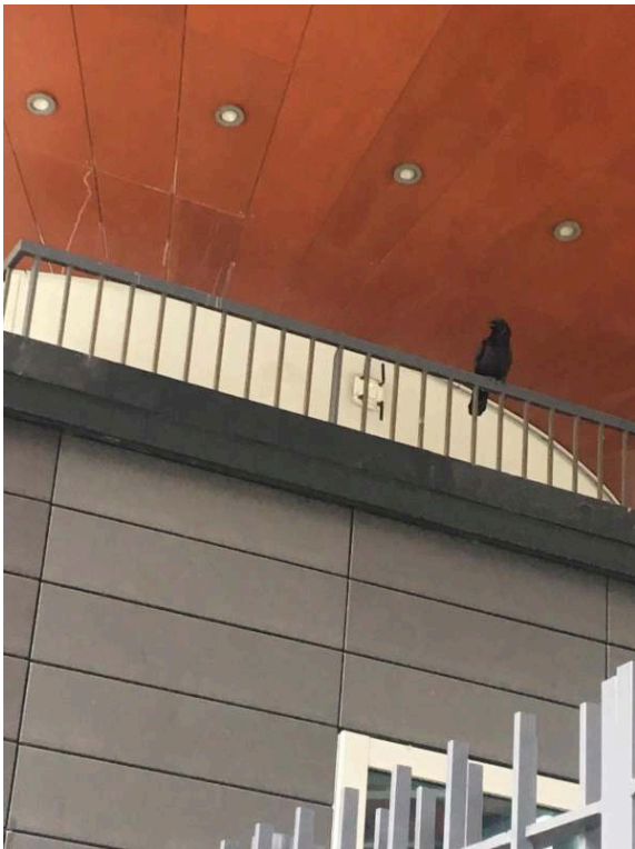
Photographies prises lors de la promenade, Paris, quartier Jussieu, 2018. Cedissia About, 2018.