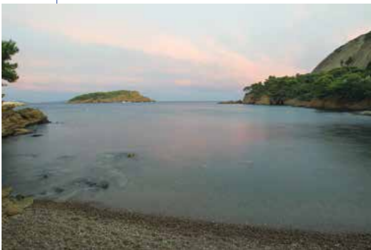
1. Île Verte.

La transformation du poisson a fait l'objet depuis l'Antiquité d'un intérêt soutenu par les populations car elle leur assurait la disponibilité de cette denrée tout au long de l'année. Il existe plusieurs modes de transformation du poisson, parmi lesquels le séchage et le fumage, qui ont laissé très peu de traces. En revanche, la production de salaisons et de sauces de poisson, et notamment du garum , était réalisée dans des ateliers que l'on retrouve sur toutes les côtes de la Méditerranée, et notamment sur les petites îles.