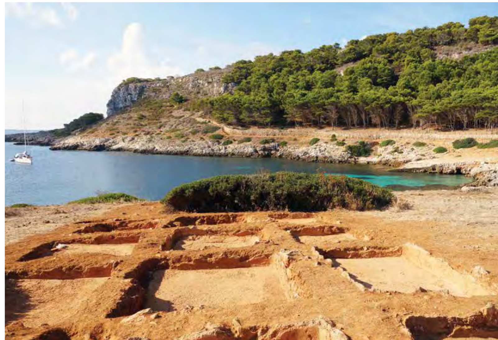
2. Atelier de transformation du poisson, île de Levanzo, Sicile. Fouille Emmanuel Botte, 2014.

Emmanuel Botte, Salaisons et sauces de poissons en Italie du Sud et en Sicile durant l'Antiquité , Naples, Centre Jean-Bérard, (Collection, 31; Archéologie de l'artisanat antique, 1), 2009.