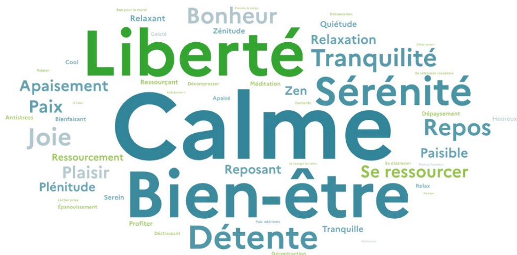
Note : la valeur cumulée des termes présentés dans cette figure correspond à 3 214 occurrences. Source : CGDD/SDES, enquête « Les Français et la nature », 2020

Au regard de l'histoire de la philosophie européenne, cette association de la nature et de la liberté peut sembler paradoxale. Dans le cadre antique, par exemple, la nature était souvent perçue comme le lieu de la contrainte et de la nécessité, gouvernée par un strict déterminisme sur lequel l'homme n'avait que peu de prise. À l'inverse, seule la cité, lieu du droit, permettait à l'homme d'exercer une forme d'autonomie et