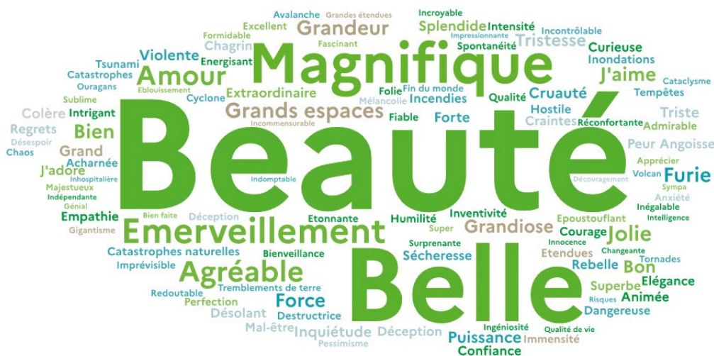
Note : la valeur cumulée des termes présentés dans cette figure correspond à 1 485 occurrences.

Au niveau des affects liés à la nature, l'axe positif (admiration) domine clairement : les Français « aiment » la nature, et peu semblent la craindre ou la haïr. Par ailleurs, les craintes exprimées sont essentiellement liées à des « catastrophes », donc à des événements perçus comme anormaux voire contre-nature, d'autant que certains sont aggravés, voire provoqués, par les activités humaines. On remarquera à l'inverse que les affects négatifs n'impliquent quasiment jamais la nature (prédateurs, parasites, nuisibles, maladies...) et se limitent à quelques rares reproches formulés à l'encontre des moustiques. Également discuté dans l'article de Glatron, Comor et Philippot (pp. 48-56), ce constat illustre un renversement important par rapport aux siècles précédents où l'imaginaire de la forêt sombre et terrifiante, peuplée de bêtes sauvages, constituait une source importante d'affects négatifs, par opposition à la « civilisation » perçue comme protectrice et garante de la liberté.