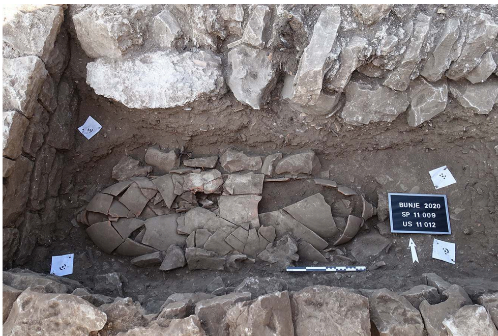
Fig. 5. Vue depuis le sud de la sépulture SP 11009, aménagée dans les amphores 11008 et 11013.