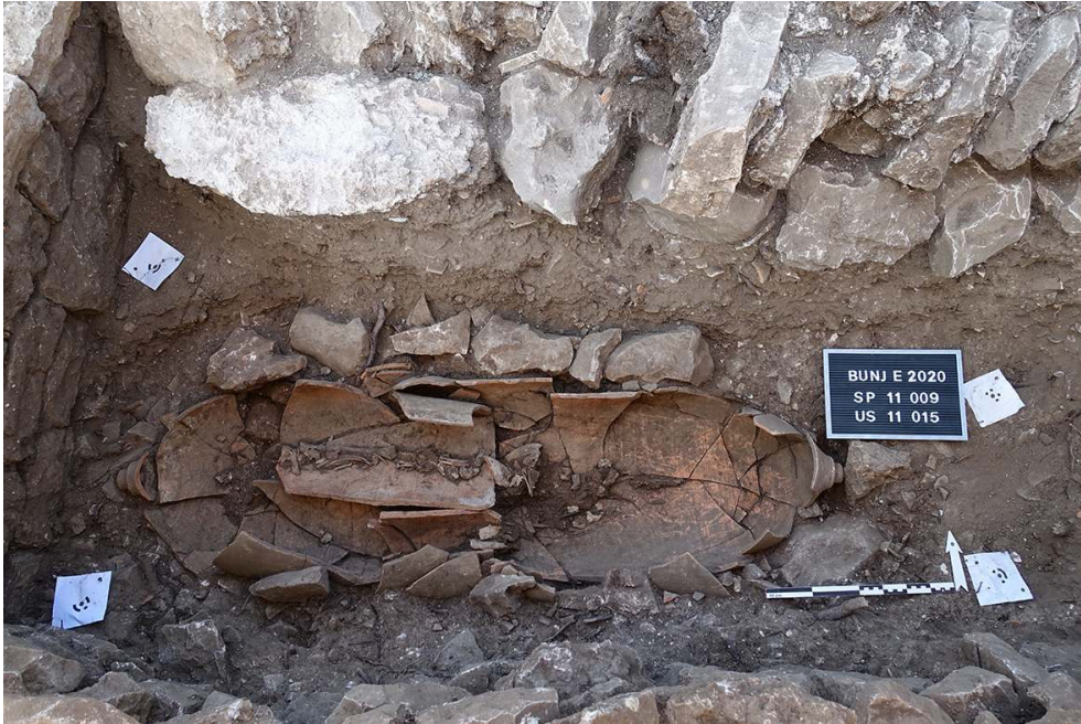
Fig. 6. Vue depuis le sud des restes osseux de la sépulture SP 11009.