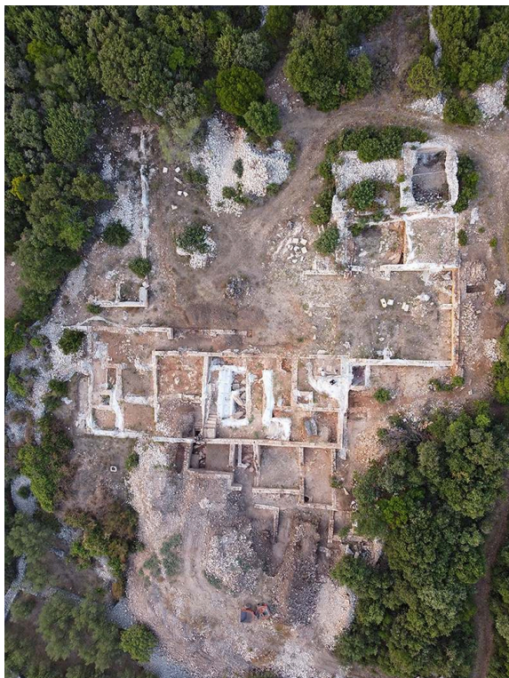
Fig. 3. Vue d'ensemble de la villa, avec dans la partie basse la terrasse inférieure en cours de fouille.