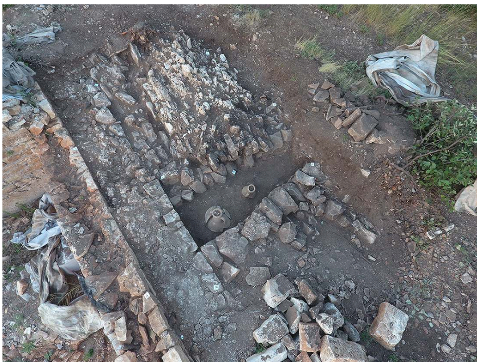
Fig. 4. Vue depuis le sud-ouest de la structure bâtie SB 11003, et de la sépulture SP 11009 installée sur son flanc sud.