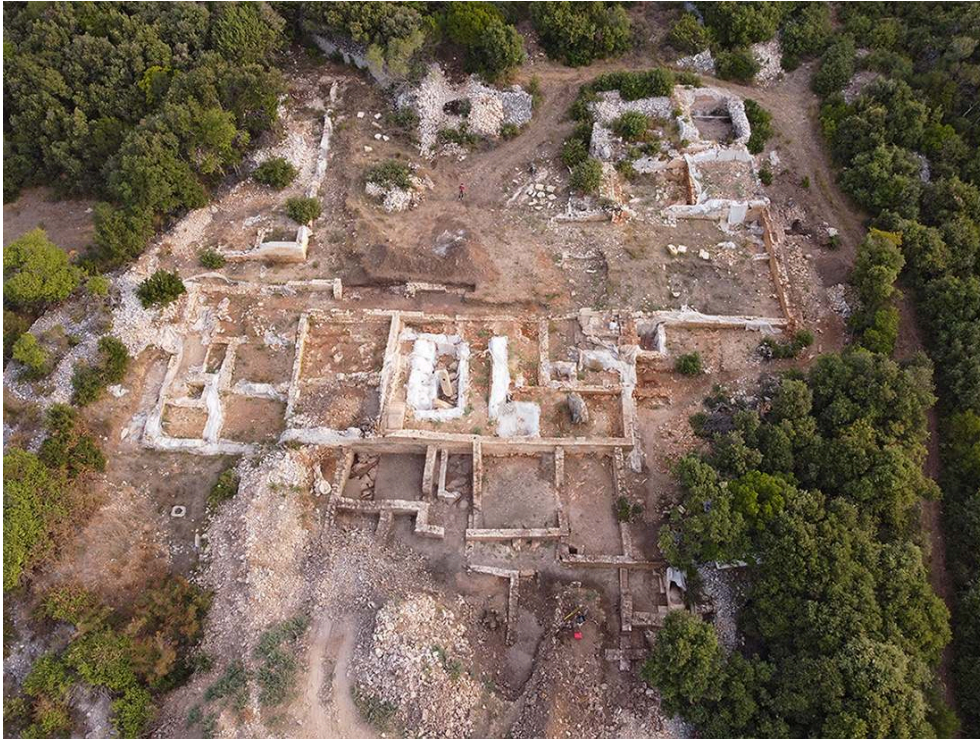
Fig. 9. Vue par drone de la villa à la fin de la campagne.