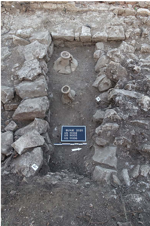
Fig. 7. Vue depuis l'est des cols d'amphores 11002 et 11005.