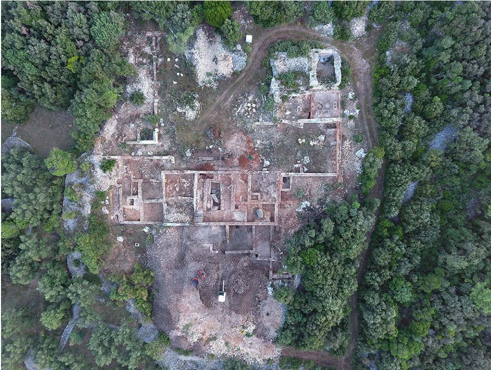
Fig. 1. Vue par drone de la villa au début de la campagne.