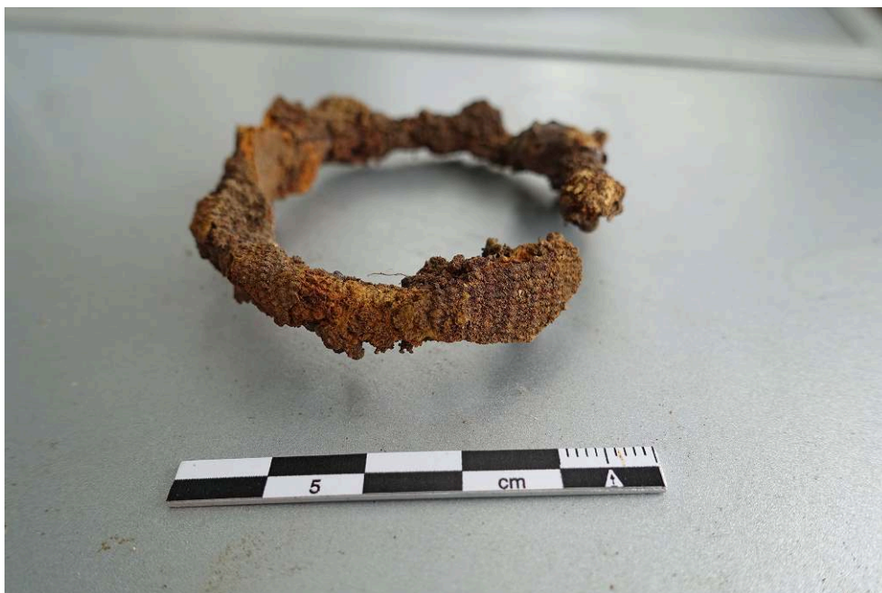
Fig. 8. Restes de tissu contre le bracelet découvert dans la sépulture SP 11009.