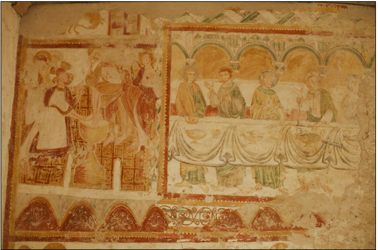
Fig. 1– Rochecorbon, église Saint-Georges : nef, mur nord, Lavement des pieds (à gauche), Cène (à droite). Cl. A. Marzais.