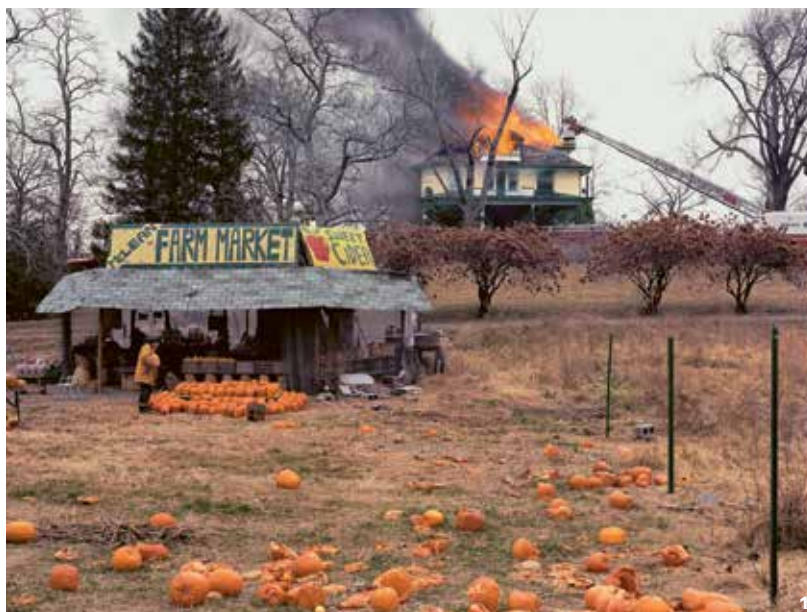
1 Joel Sternfeld, tiré de la série American Prospects , 1987