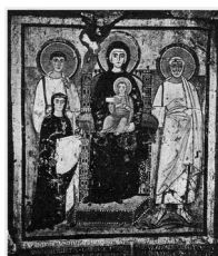
Fresque-icône de la donatrice Turtura (au premier plan à gauche), catacombe de Comodilla, Rome, 528