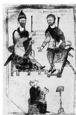
Charlemagne et son fils Pépin, roi d'Italie, en train de juger (bâton de justice à la main, épée au côté), manuscrit du IX e siècle

Autres exemples de représentations de Charlemagne ou d'autres souverains :