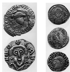
Monnaies d'or mérovingiennes, VII e siècle : on y trouve les effigies de Chilbert I er (511-558), Théodobert I er (534-548), et Dagobert I er (629-639)