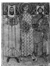
Saint Démétrius entouré du préfet Léonce et de l'évêque Jean, Salonique, Saint Démétrius, vers 630

Mais, de la même façon que les portraits officiels égyptiens ou mésopotamiens mêlaient des divinités et des personnes réelles, l'iconographie religieuse de Byzance et de Rome, désormais siège de la papauté, ne se limitait pas aux images du Christ, de la Vierge et des saints. « C'est au VI e siècle que la hiérarchie céleste entre en contact direct avec les hommes. Les images se rapprochent du croyant en prenant la forme du tableau. Il s'agit soit de peintures murales placées à la hauteur du regard, soit des icônes portatives qu'on voit se répandre. En même temps, le saint auréolé entre en contact, à l'intérieur de l'image, avec le dignitaire au nimbe carré, et même avec le donateur profane, qui passe ainsi de l'autre côté de l'image. Le ciel et la terre communiquent alors dans une hiérarchie ponctuée par les marques de vénération. » (Wirth, 1989 : 97-99) On trouve ainsi sur des mosaïques ou, plus rarement, sur quelques fresques de cette époque (qui ont été conservées parce qu'occultées longtemps sous d'autres couches de peintures successives), des saints entourés d'évêques, de préfets ou des donateurs.