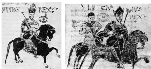
Les rois Pépin d'Italie et Lothaire I er , Codex Legum Longobardorum , XI e siècle : à cheval en costume d'apparat, le bâton de justice à la main – un guerrier suit Lothaire, lance à la main et trompe de chasse au cou