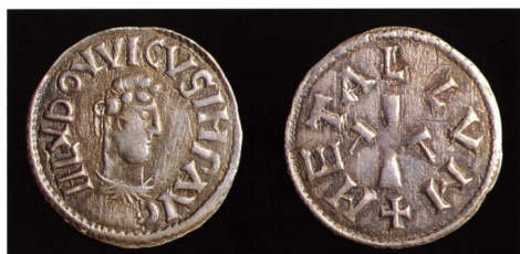
Monnaie à l'effigie de Louis le Pieux, 820

Un contre-exemple, toutefois : en 820, Louis le Pieux réintroduisit l'effigie royale dans les monnaies :