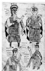
Lodhari, roi des Alamans (il remet sa loi à un évêque, à un duc et à un comte), manuscrit d'un bréviaire d'Alaric, 700-750

Voici quelques-uns des premiers exemples conservés :