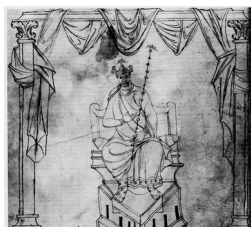
Charlemagne (bâton de justice à la main), en-tête d'un recueil de capitulaires 1 , IX e siècle