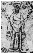
La défunte Comminia, Catacombes de saint Janvier, Naples, (IV e ou V e siècle)