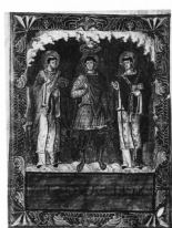
Couronnement d'un prince franc (probablement Charlemagne), entre les papes Saint-Grégoire et Saint Adrien 1 er Sacramentaire dit de Metz, IX e siècle

A la même époque, on trouve dans certains manuscrits des représentations du jeune prince qui allait devenir Charlemagne, réalisées certainement après sa mort et dont il est impossible de déterminer dans quelle mesure elles restituent sa véritable physionomie.