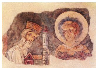
Le roi Bozon offre à Saint-Etienne l'abbaye de Charlieu qu'il a fondée (fresque peinte vers 900-950, c'est-à-dire après sa mort, survenue en 888)