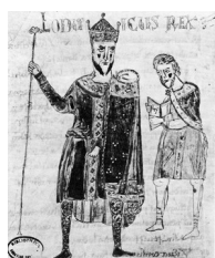
Louis le Pieux, empereur, en-tête de ses propres capitulaires, date ?

Les souverains carolingiens faisaient donc réaliser des images, en particulier des portraits d'eux, mais pour leur propre usage. On sait en particulier que Charlemagne avait fait décorer son palais d'images profanes, dont des portraits de lui-même, de ses prédécesseurs chrétiens, mais aussi païens 2 .