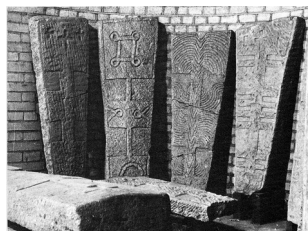
Sarcophages, Poitiers, baptistère Saint Jean, VI e -VII e siècle