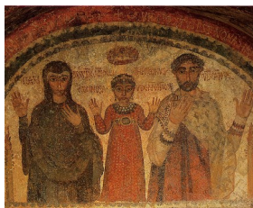
Les défunts Théoctecnos, Nonnosa et Hilaritas, dans les catacombes de saint Janvier, Naples (V e siècle)

Vivant dans un monde rempli d'images, les premiers chrétiens ne semblent pas avoir manifesté d'hostilité particulière vis-à-vis des décorations figuratives qui pouvaient orner leurs lieux ou leurs objets de culte. On en trouve dans les catacombes ainsi que dans les sépultures. Ce recours à l'image pouvait même servir la mémoire des défunts : certains des portraits du Fayoum, on l'a vu, représentent des chrétiens, et il y a tout lieu de penser que beaucoup d'autres ont été peints à travers tout l'Empire romain, bien qu'il ne nous en reste peu de traces. Bref, les premiers chrétiens partageaient la culture visuelle de leur temps.