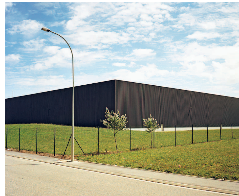
Vers Montauban, 2010.

les petites villes. Même si le rôle des architectes-conseils consiste notamment à aider les élus à faire bien ou mieux ces lotissements, le sentiment général est qu'il s'agit surtout de « trouver une ou des alternatives au lotissement pavillonnaire », et d'abord de réparer la ville ou les villages, de réorganiser les périphéries. En somme, l'urgence consisterait donc d'abord à tirer parti de l'existant, ce qui suppose que des études sérieuses soient menées non seulement sur le « patrimoine », mais aussi sur le « potentiel » de ce qui est déjà là (et en particulier des centres-bourgs), c'est-à-dire sur sa capacité à muter localement pour accueillir de nouveaux habitants et de nouveaux usages, et éviter de déplacer toujours ailleurs les problèmes.