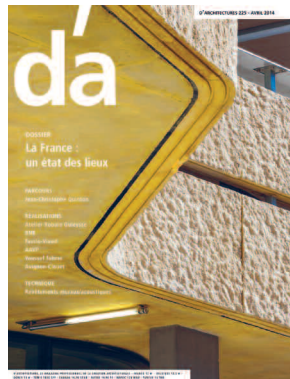
En couverture : Foyer d'accueil de la Mie de Pain