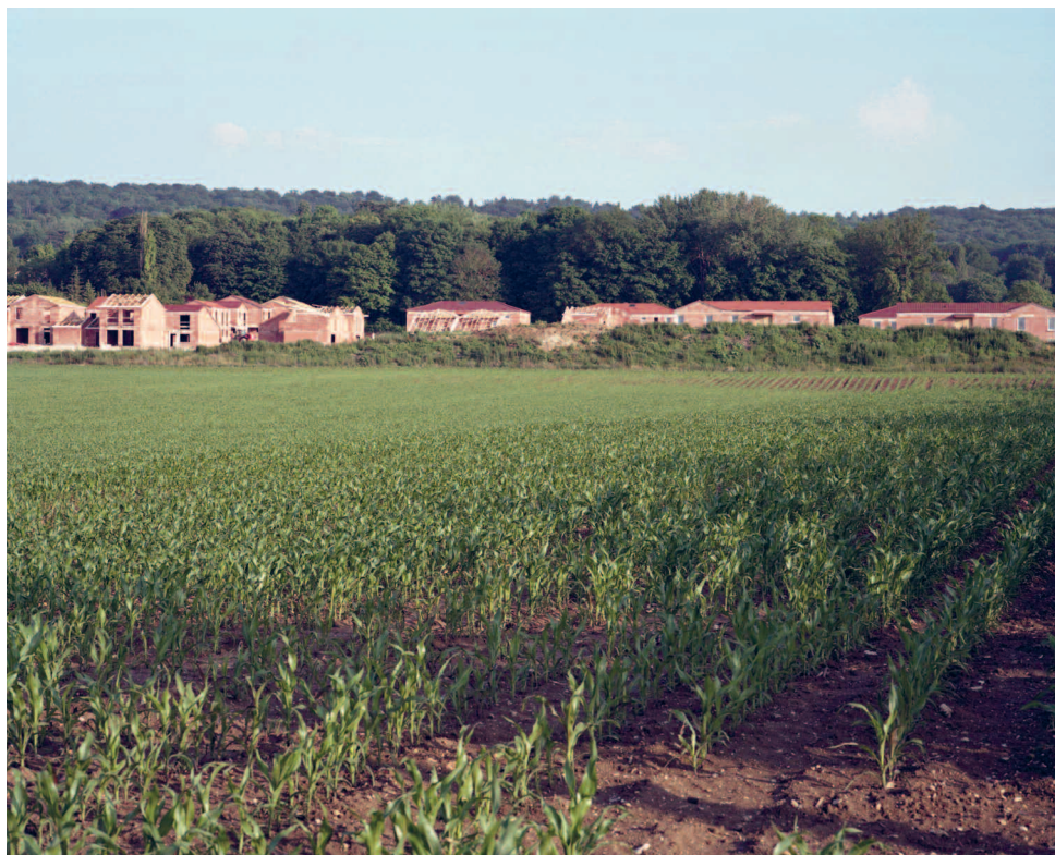
Observatoire photographique du Parc naturel régional de la montagne de Reims, 2012.

de ces deux références, les architectes-conseils pourraient collectivement produire un état des lieux de la fabrique des territoires qui, en éclairant nos concitoyens sur les mondes que nous sommes en train de produire, ou de négliger, permettrait du même coup de dégager, sinon les articles d'une doctrine, du moins les linéaments d'une philosophie ou d'une prospective. Et je crois que dans la période de transition environnementale qui est la nôtre, nous en avons tous sacrément besoin. ■