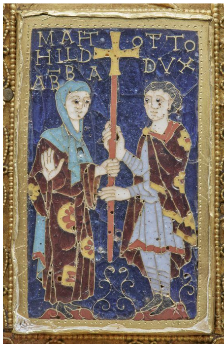
Fig. 6 Croix de Mathilde d'Essen (détail), après 984, émail. Cathédrale Saints-Côme-et-Damien-et-Marie (Essen), inv.-nr. 3.

On peut étendre cette analyse à d'autres aspects, en s'appuyant là aussi sur une iconographie riche de sens. Deux exemples, en particulier, semblent montrer un décalage dans la représentation du corps des femmes ou, du moins, un positionnement politique exprimé par le corps.