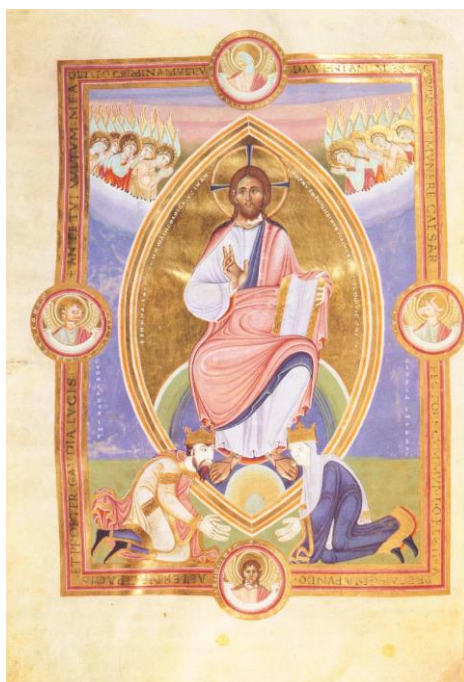
Fig. 5 L'empereur Conrad et son épouse Gisèle aux pieds du Christ. Codex d'Or de Spire, vers 1045, parchemin.

Il s'agit donc d'une mise en scène de la transmission du pouvoir dynastique : Henri reçoit son pouvoir à la fois de sa mère, qui lui transmet, et de Dieu 27 .