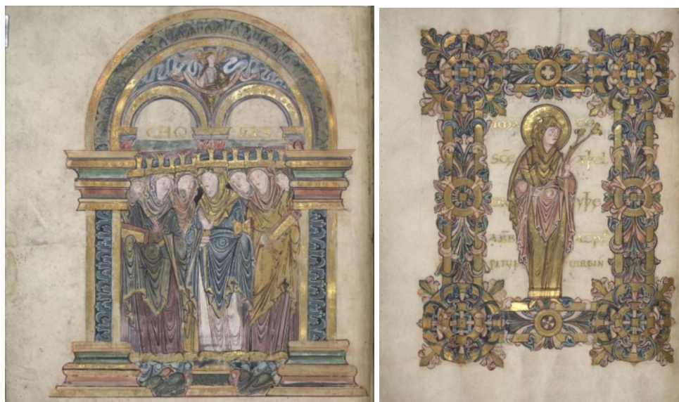
Fig. 9 Le chœur des vierges et sainte Æthelthryth. Bénédictionnaire d'Æthelwold, vers 970, parchemin. British Library (Londres), Additional MS 49598, fol. 1v et 90v. Digitalización de la British Library: https://www.bl.uk/manuscripts/FullDisplay.aspx?ref=Add_MS_49598