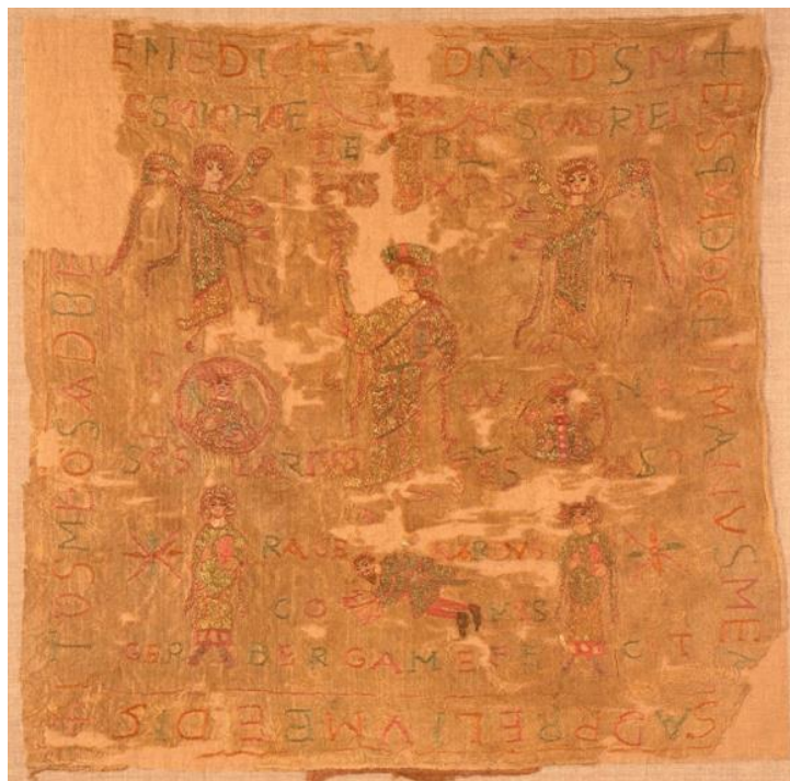
Fig. 7 Bannière de Gerberge, vers 960, soie et fil d'or. Cathédrale Saint-Pierre (Cologne), inv. L I, VIII.

se montrer comme héritière symbolique de son frère. C'est d'autant plus frappant que la croix de Mathilde, comme celle de Gisèle, est un objet charismatique 33 destiné à être porté en procession et vu par toute la communauté : il s'agit d'une mise en scène publique de soi.