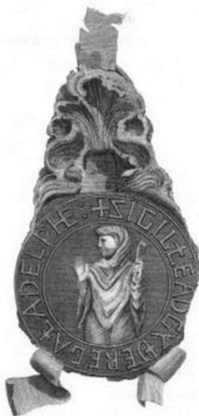
Fig. 10 Sceau d'Édith de Wilton, fin des années 970, cire. Reproduction de DOUCE Francis (1817): "Some remarks on the original seal belonging to the Abbey of Wilton", Archaeologia , n°18, pp. 40-54.

condena del cuerpo de algunas mujeres es también un medio para denigrar sus acciones políticas. Además, esta puesta en escena del cuerpo no es exclusiva de las mujeres: los estudios del periodo carolingio han demostrado, por ejemplo, que el cuerpo de los monjes podía ser un instrumento de su superioridad sobre los laicos. Sin embargo, la sexualidad y el comportamiento corporal de los hombres parecen ser menos examinados y analizados que los de las mujeres 44 . El género es, por tanto, una de las variables para el análisis de los cuerpos aristocráticos, pero habría que tener en cuenta otros parámetros, como las variaciones entre tipos de imágenes, lo que queda fuera del alcance de este artículo.