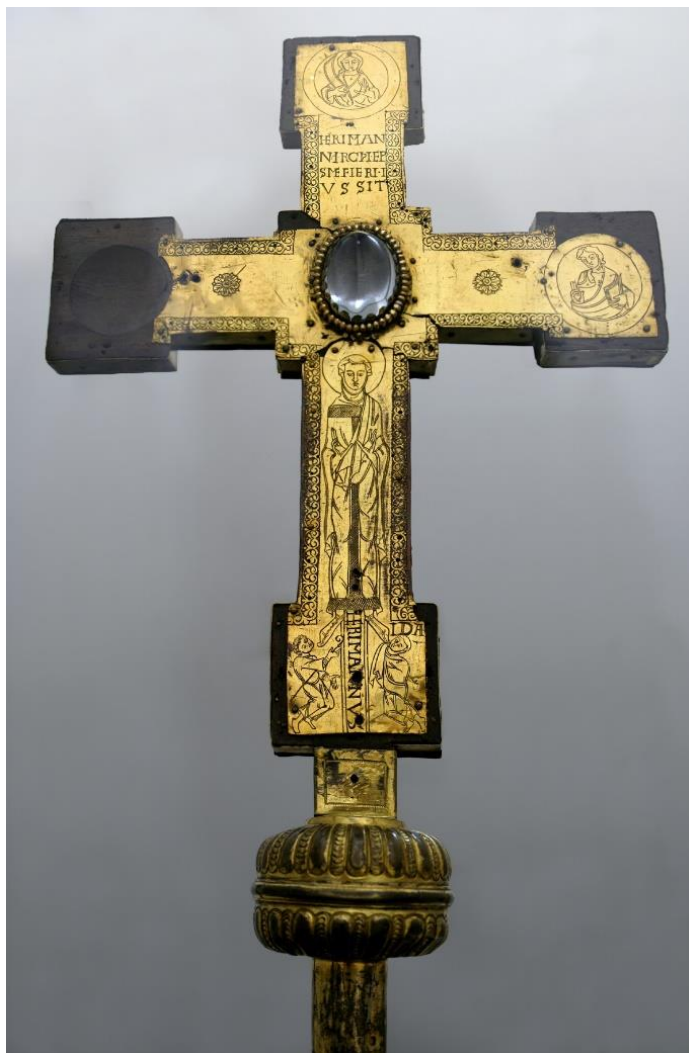
Fig. 1 Croix d'Hermann et Ida, vers 1040, bois et feuille de cuivre. Kolumba Museum (Cologne), Inv. Nr. H11.

L'absence de corporéité des femmes vertueuses, en particulier des nonnes, est visible dans l'iconographie, y compris dans l'iconographie commandée par les femmes elles-mêmes. Deux exemples à peu près contemporains permettent de le souligner.