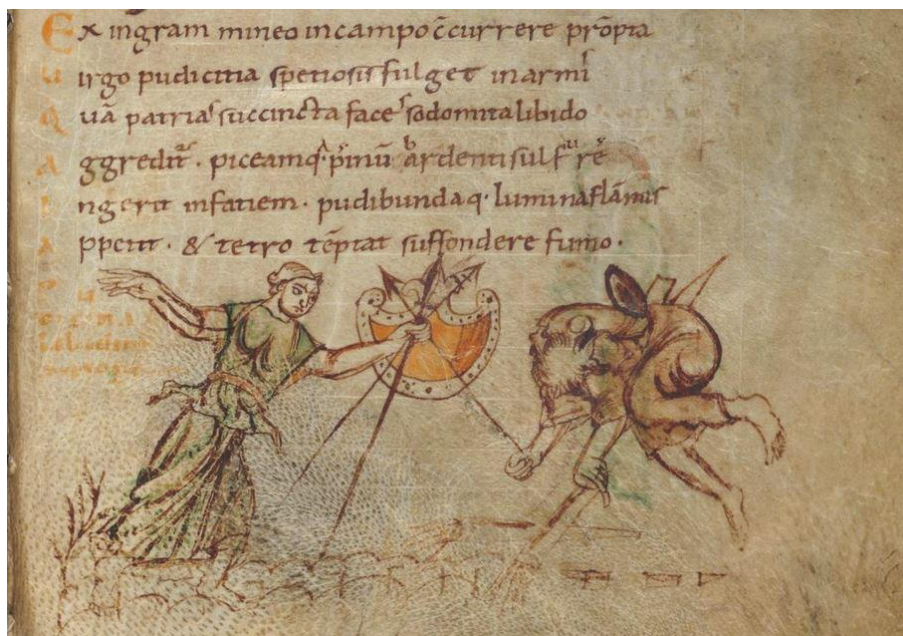
Fig. 8 Le combat de Pudeur et de Libido. Manuscrit de la Psychomachie de Prudence, X e -XI e siècle, parchemin. Bibliothèque royale de Belgique (Bruxelles), ms. 10066-77, fol. 116.

Mais la transgression par l'icôgraphie a ses limites, comme le montre la bannière de Gerberge (fig. 7). Gerberge envoie cette pièce de textile à son frère Brunon vers 960 pour commémorer une victoire commune et célébrer son rôle guerrier 36 . Toutefois, même si son nom apparaît sur la bannière, elle n'est pas représentée elle-même : il est en quelque sorte impossible de représenter la femme guerrière et victorieuse 37 .