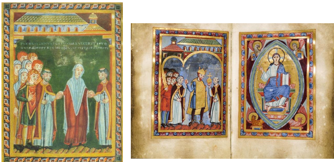
Fig. 4 Gisèle et Henri III. Péricope d'Henri III, entre 1039 et 1043, parchemin. Universitätsbibliothek (Brême), b.21, fol. 3r, 3v et 4r.

https://commons.wikimedia.org/wiki/File:Gisela_von_Schwaben,_Echternacher_Perikopenbuch.JPG y https://commons.wikimedia.org/wiki/File:Perikopenbuch_Heinrichs_III.jpg .