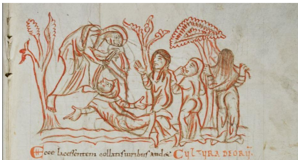
Fig. 3 Le combat de Foi et d'Idolâtrie. Manuscrit de la Psychomachie de Prudence, X e -XI e siècle, parchemin. Stiftsbibliothek (Saint-Gall), Cod. Sang. 135, p. 390.

effet chargées de confectionner des vêtements : dans l'aristocratie, cette activité typiquement féminine vise à valoriser le corps comme support de la richesse, en créant par exemple de riches manteaux brodés portés lors des cérémonies 10 . Aux yeux des clercs, l'activité textile des femmes peut être considérée comme vertueuse si elle est détournée de sa fonction initiale et ne sert plus à orner les corps de l'aristocratie, mais à décorer les églises 11 . Il existe aussi une crainte du dévoiement de cette activité textile à des fins de sorcellerie, si l'on en croit le pénitentiel de Burchard de Worms au début du XI e siècle : on craint que les femmes ne puissent enchanter les vêtements 12 . La peur du corps des femmes tient donc en partie à leur rôle dans l'ornementation des corps, féminins comme masculins. Pour les clercs, la seule manière de contrer ces pratiques est de faire en sorte de les détourner à leur profit : l'activité textile est vertueuse si elle ne sert pas les buts ostentatoires de l'aristocratie mais ceux de l'Église. On note donc une volonté de l'Église de discipliner les corps et les activités féminines.