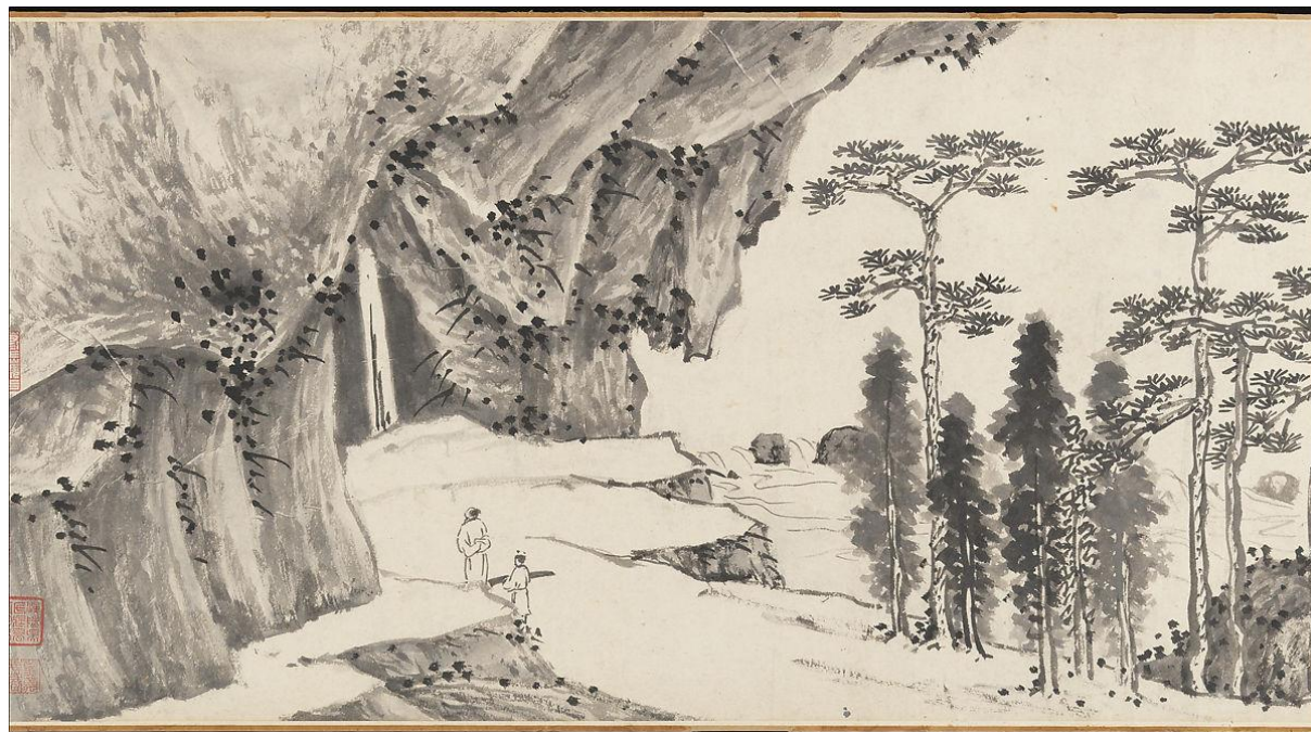
Ill. 3 Shen Zhou (1427-1509), Wen Zhengming (1470-1559), Montagnes et eaux conjointes (Joint Landscape) , daté 1509-1546, encre et couleurs sur papier, 36,8 x 1729,3 cm, détail, New York, Metropolitan Museum of Art.

4/ Le développement du marché a accentué cette tendance à la quête d'authenticité ; la quantité des peintures a fortement cru, de nombreux rouleaux sont apparus qui n'avaient jamais été commentés auparavant ou même mentionnés dans aucun catalogue. De plus, une part du marché est occupée par des non-professionnels.