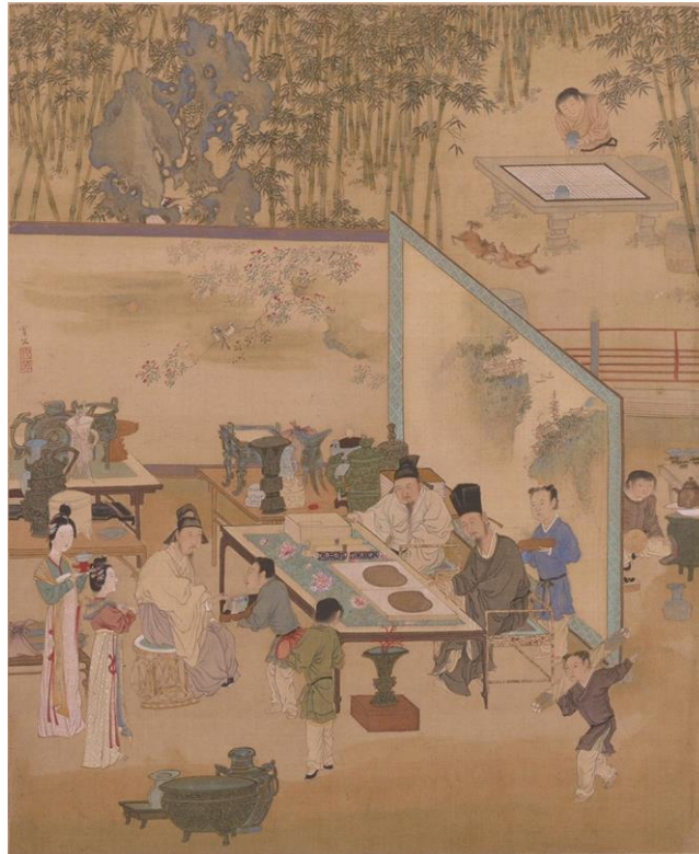
Ill. 2 Qiu Ying (1494 ?-1552), Apprécier les antiquités dans la cour des bambous ( Zhuyuan pin gu ), encre et couleurs sur soie, 41,4 x 33,8 cm, Pékin, musée de l'Ancien palais. On remarque, parmi les objets collectionnés et appréciés par les lettrés, des livres, des rouleaux et, sur les tables à côté de celle des lettrés, de nombreux bronzes antiques.

Les lettrés qui constituent ces collections sont tout à fait conscients de l'impermanence de leurs collections ; ils soulignent tous que seules les valeurs immatérielles se transmettent, alors que les biens matériels disparaissent inéluctablement 15 . Cette conception du patrimoine n'est pas celle que nous connaissons aujourd'hui ; aux yeux de leurs propriétaires, les objets collectionnés étaient des moyens de communication avec le monde des esprits et des divinités, ou encore des emblèmes de rang social ou de richesse. Ils ne possédaient pas nécessairement de valeur historique ou culturelle, ou plus exactement, si cette valeur historique et culturelle était reconnue, elle demeurait secondaire par rapport à d'autres valeurs d'ordre social, spirituel ou idéologique.