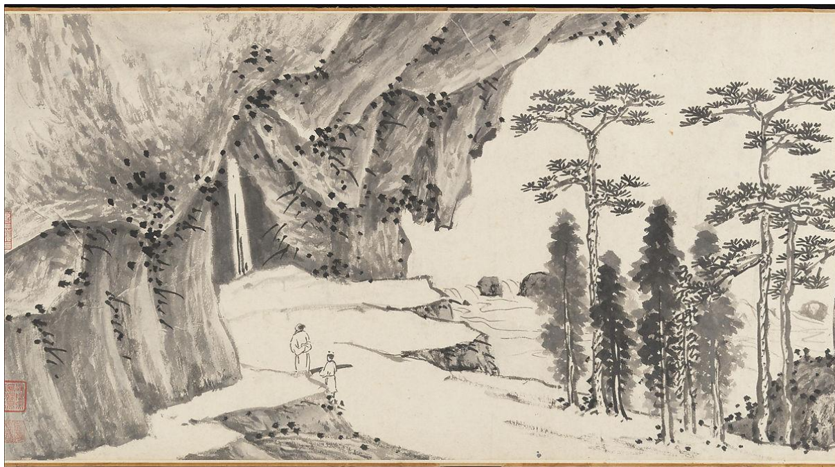
Ill. 3 Shen Zhou (1427-1509), Wen Zhengming (1470-1559), Montagnes et eaux conjointes (Joint Landscape) , daté 1509-1546, encre et couleurs sur papier, 36,8 x 1729,3 cm, détail, New York, Metropolitan Museum of Art.

4/ Le développement du marché a accentué cette tendance à la quête d'authenticité ; la quantité des peintures a fortement cru, de nombreux rouleaux sont apparus qui n'avaient jamais été commentés auparavant ou même mentionnés dans aucun catalogue. De plus, une part du marché est occupée par des non-professionnels.