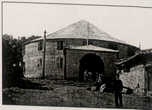
Jo Yeong-kyu, L'histoire corrigée de Hyeopryulsa et de Wankaksa , Minsokwan, 2008.

Le premier « théâtre » en Corée en (1902) : 희대, 戲臺, Huidae (소춘대, 笑春臺, Sochyundae ) et 협률사, 協律社, Hyeob Ryul Sa