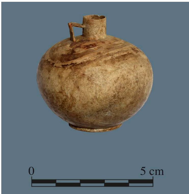
Fig. 3. Aryballe, ivoire, de Pompéi I 16, 3, inv. 11879.