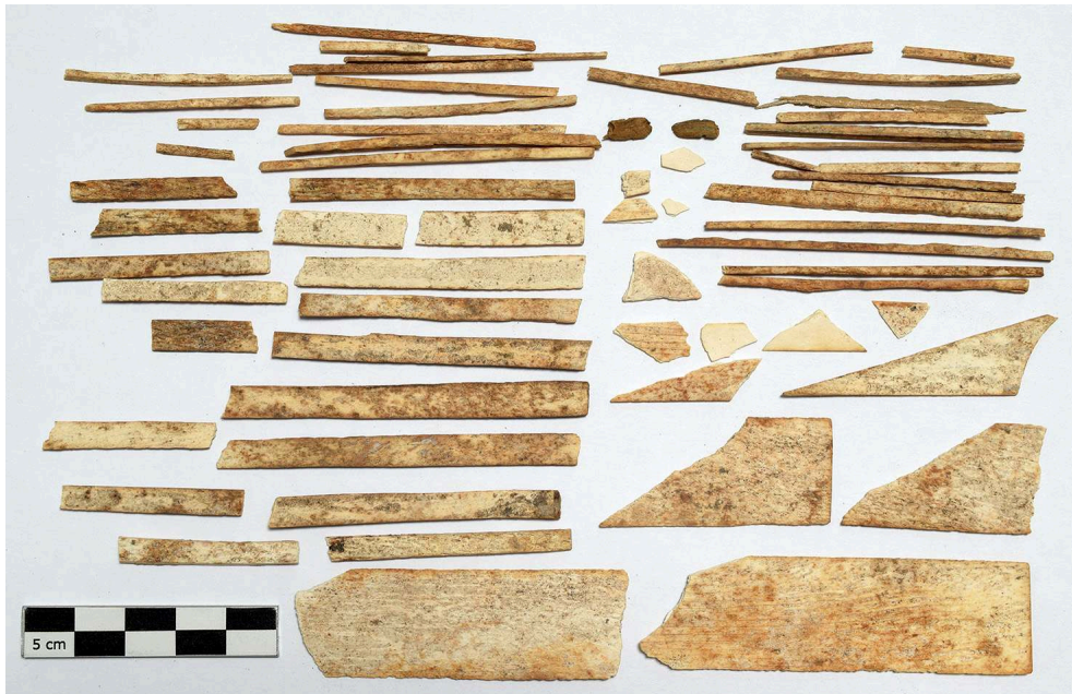
A. Cormier, sur concession du MIC – PA Pompei. Tous droits réservés.