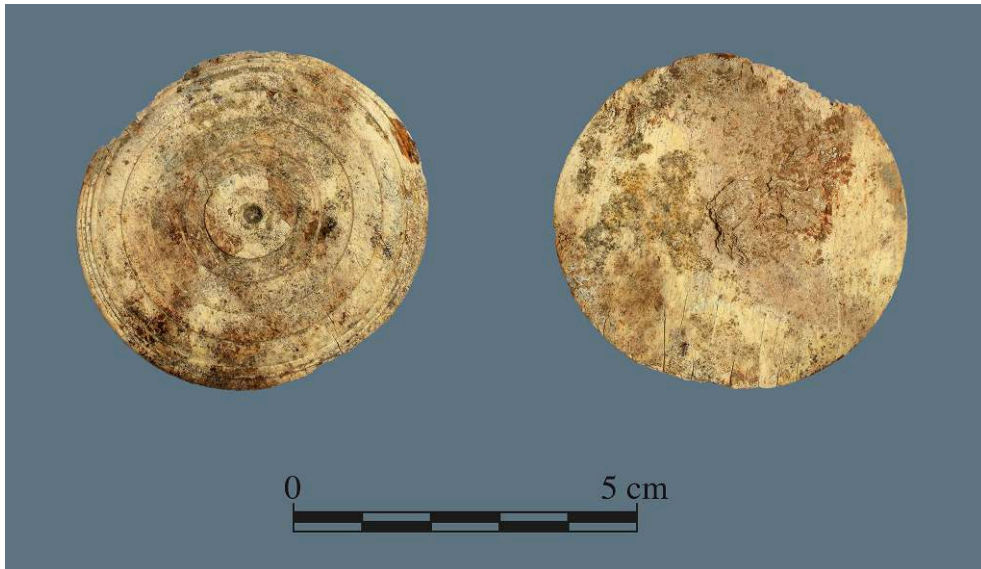
Fig. 2. Couvercle de pyxide, ivoire, de Pompéi I 16, 3, inv. 11909B.