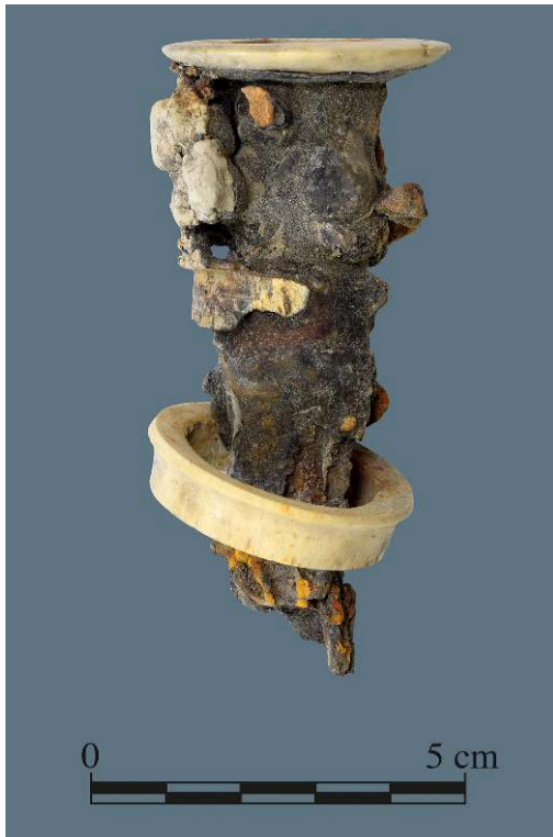
Fig. 1. Fragment de montant de lit, os, bois et métal, de Pompéi I 16, 3, inv. 1200I.