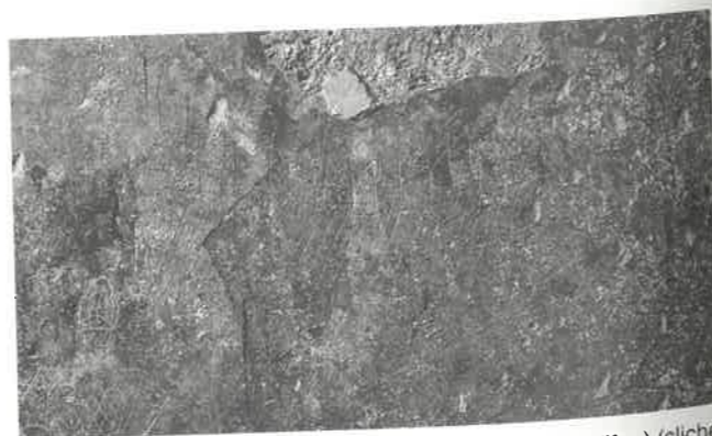
Fig. 191 – TOULON, îlot Baudin. Graffitis de bateau (XVI e s.).

Sur les enduits muraux contemporains ou à peine postérieurs au plafond ont été relevés de nombreux graffitis de végétaux, d'animaux, de personnages plus ou moins stylisés et surtout de bateaux (fig. 191).