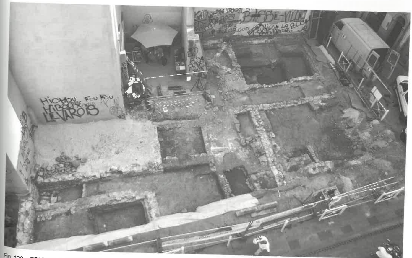
Fig. 190 – TOULON, rue Pierre Sépard. Vue générale du chantier après décapage et nettoyage des vestiges modernes.

Au final, la localisation de cet aménagement, ses dimensions assez importantes et sa relative complexité semblent exclure une destination domestique et renvoient à un statut semi-artisanal. L'absence de scories et fosses de rejets à proximité évoque implicitement la cuisson d'éléments d'origine organique : dans ce cadre, une interprétation plausible mais pas exclusive pourrait être celle d'un four de boulangerie destiné à la cuisson de pains et galettes.