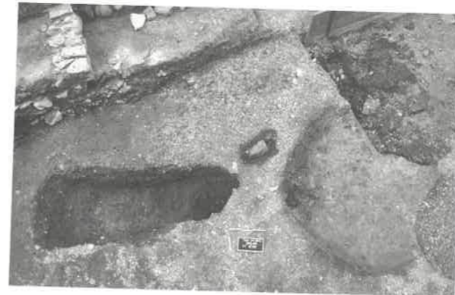
Fig. 189 – TOULON, rue Pierre Sépard. Vue orthogonale du foyer antique et de son canal d'évent, depuis le nord.

L'espace situé entre ces deux unités d'habitation, d'une superficie restituable d'environ 100 m 2 , ne comportait pas de rue orientée dans l'axe nord-sud comme aurait pu l'induire l'urbanisation du quartier. Au-dessus d'un niveau de circulation dont plusieurs lambeaux ont été épargnés par les surcreusements modernes, la fouille a permis de découvrir une structure foyère circulaire d'assez grande envergure (diam. 1,55 m) directement reliée à une fosse oblongue (L. 1,85 m) par un conduit creusé dans le substrat, faisant peut-être office de canal d'évent (fig. 189).