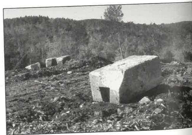
Fig 144 – BRIGNOLES, domaine de la Lieue. Vue des contrepoids.