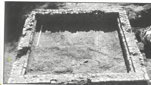
Fig. 145 – CABASSE, la Grande Pièce. L'enclos funéraire (PCE 1020) vu du nord.

Le principal d'entre eux est un enclos au plan carré (36 m 2 ), doté d'élévations en petit appareil réglé de moellons calcaires (fig. 145). Un empierré dense et épais de 0,20 m fait office de sol : au-dessus de ce niveau, une couche riche en débris de céramique culinaire et faune pourrait renvoyer à des restes de repas funéraires. L'enclos abrite trois crémations en dépôt secondaire, dont une contenue dans une urne en verre de facture soignée, protégée par une urne en grès des Maures.