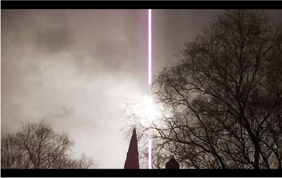
Delaine Le Bas, Glasgow Gypsyland , 2013.