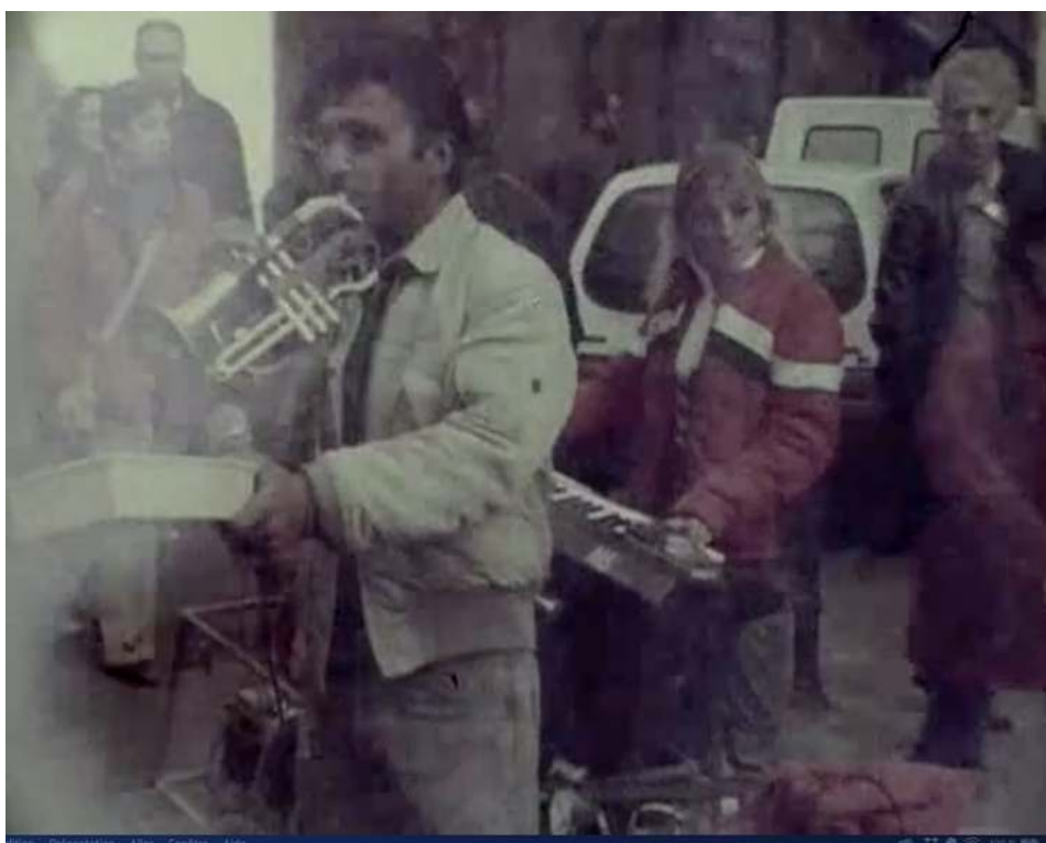
Ben Vine, Olvido , 2008.