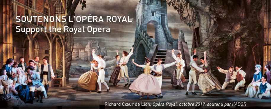
Richard Cœur de Lion, Opéra Royal, octobre 2019, soutenu par L'ADOR

Château de Versailles Spectacles, filiale privée du Château de Versailles, a pour mission de perpétuer le foisonnement musical et artistique qui fait rayonner la résidence royale dans le monde entier. Elle produit la saison musicale de l'Opéra Royal, soit près d'une centaine de représentations par an à l'Opéra Royal et à la Chapelle Royale, des concerts d'exception au Salon d'Hercule et dans la Galerie des Glaces ainsi que les grands spectacles de plein air à l'Orangerie. Elle ne reçoit aucune subvention publique. Ses recettes de billetterie et le soutien de donateurs privés et d'entreprises mécènes lui permettent de construire une saison riche qui réunit plus de 50 000 spectateurs par an.