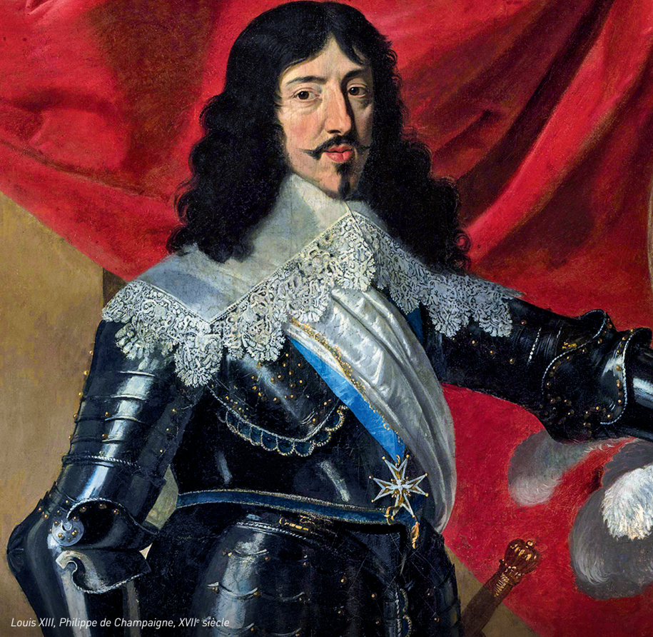
Louis XIII, Philippe de Champaigne, XVII e siècle